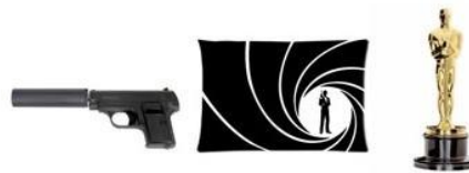
SECOND GROUP OF IMAGES