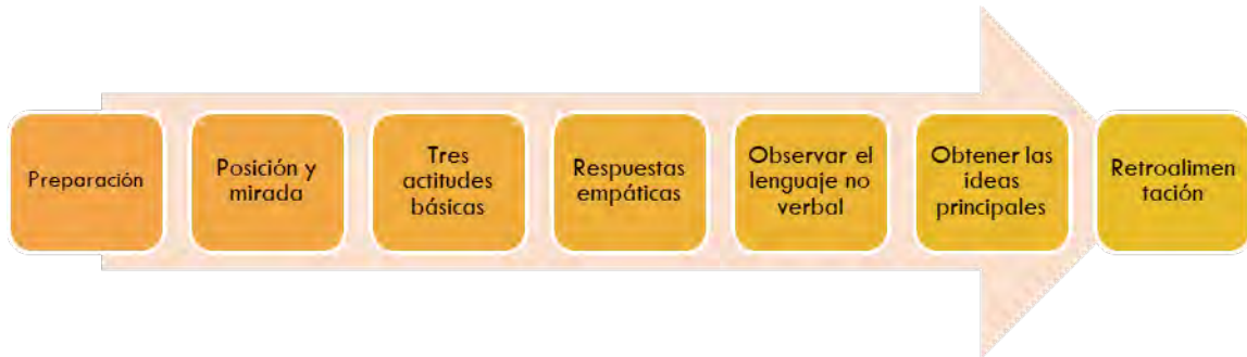
Figura 1: Proceso escucha activa