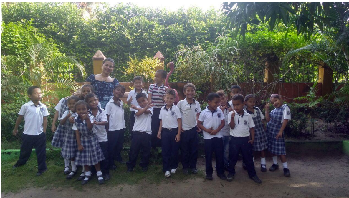
Visita a una vivienda