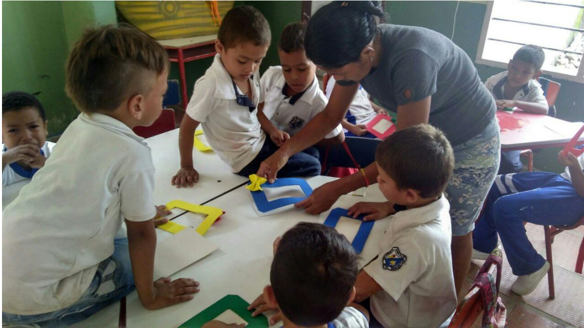
Regalo para mi familia (elaboración de porta retratos)