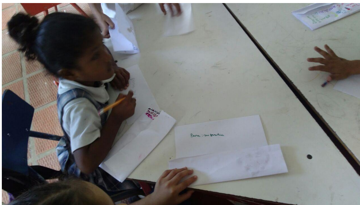
Elaboración de cartas