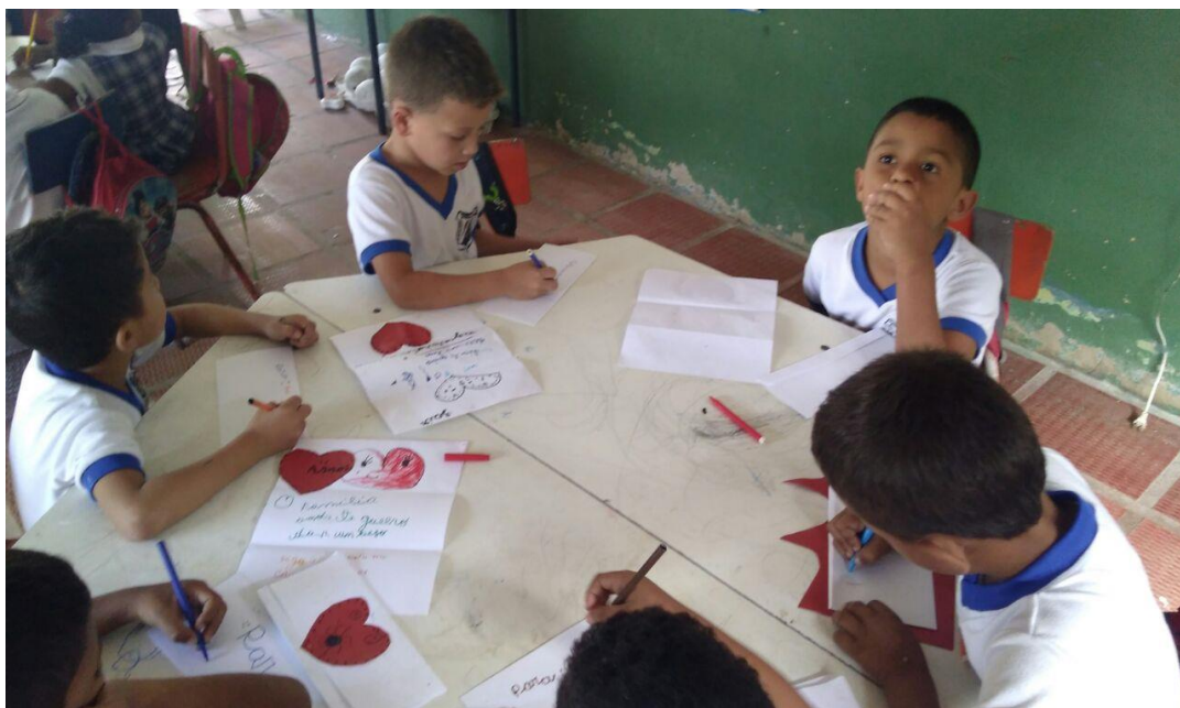
Niños elaborando la carta