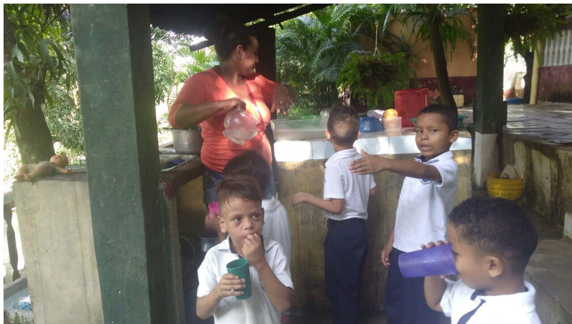
Visita a una vivienda