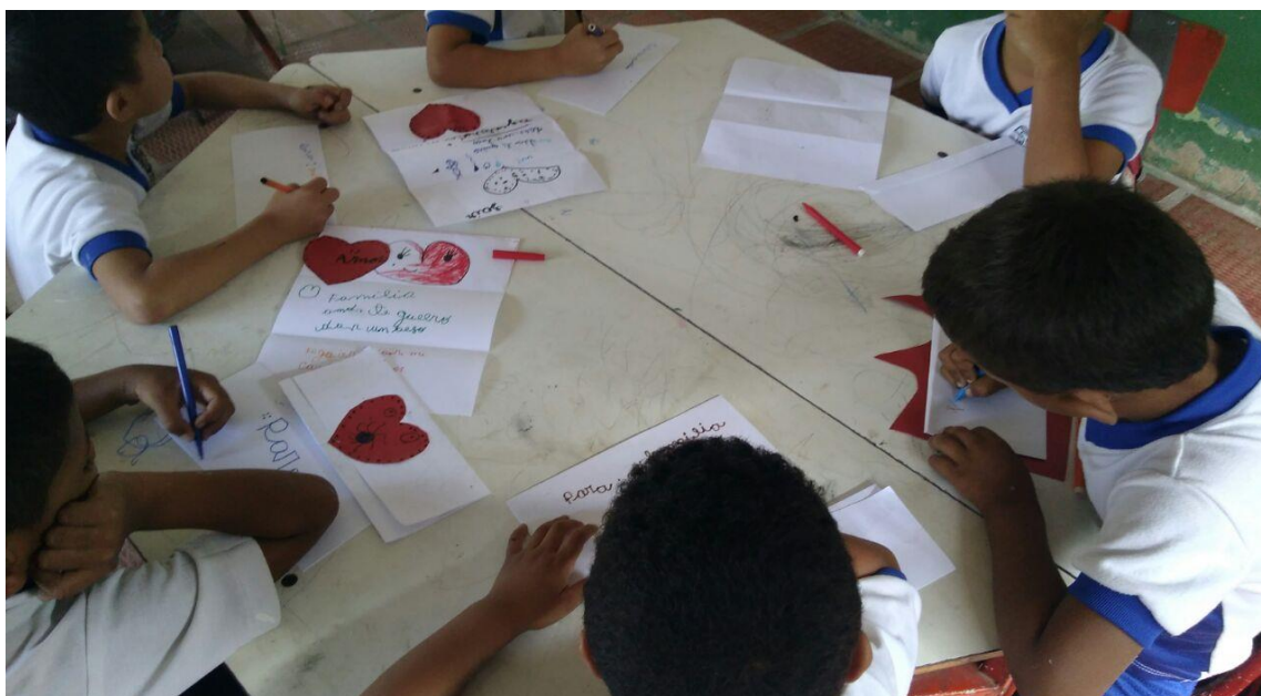
Elaboración de cartas