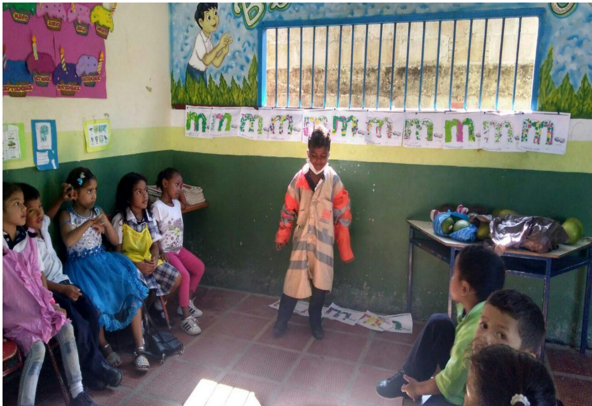
Representación de roles