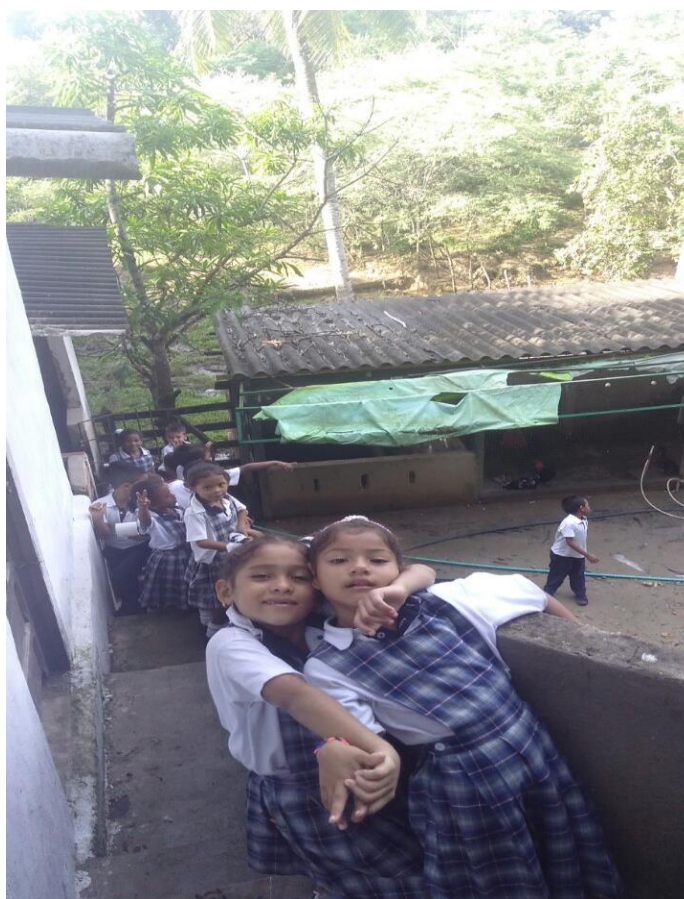
Visita a una vivienda