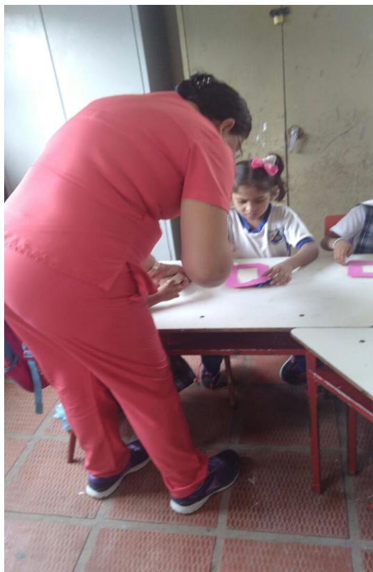
Elaboración de porta retratos