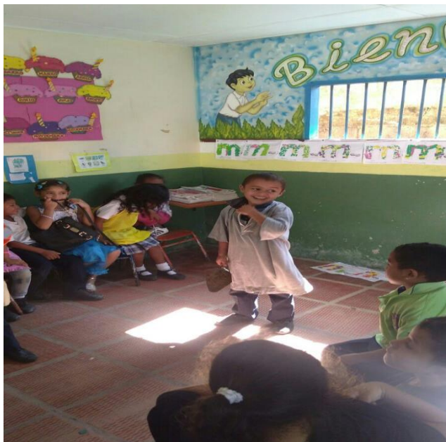
Socialización del árbol genealógico:

Representación de roles de los miembros de la familia.