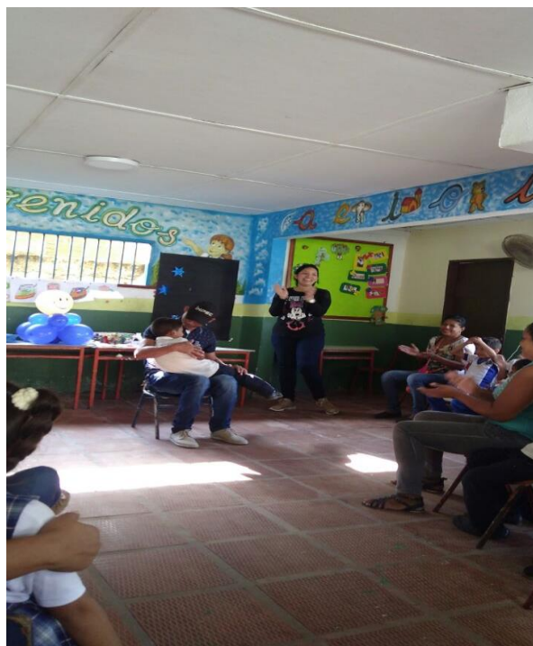
Juegos con padres