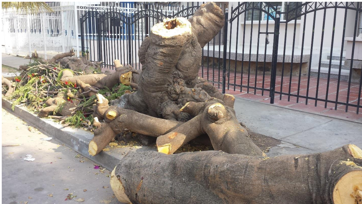
Anexo 2. Tala de arboles