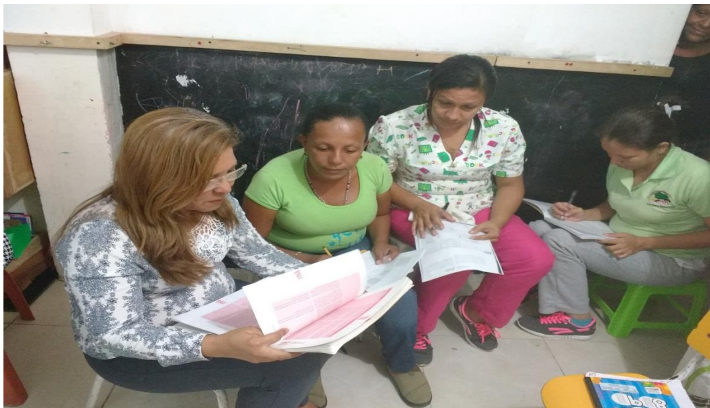
Trabajo docentes durante jornada de socialización de la estrategia NTI