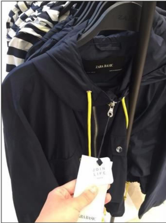
Imagen 4. Prenda Join Life y Zara Basic