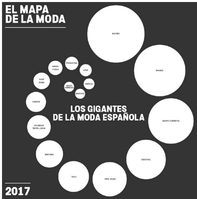
Gráfico 1. Mapa de la Moda 2017

La muestra española para la investigación ha sido elegida por ser sus miembros líderes de la moda española en el 2017 y años precedentes, en función de su facturación. El Mapa de la Moda 3 / 4 una de las principales guías del sector realizada por Modaes.es, líder en información económica del negocio de la moda 3 / 4 muestra las posiciones de todos los líderes de la moda española en función de su facturación (Riaño y Pérez Gestal, 2017). Las posiciones son en primer lugar Inditex, en segundo Mango, en tercero Grupo Cortefiel, en cuarto Desigual y en quinto Pepe Jeans (véase Gráfico 1). Dichas posiciones siguen en el mismo orden que en el 2016. Las dos líderes son empresas consideradas como fast fashion y con sede en España: Zara en La Coruña y Mango en Barcelona.