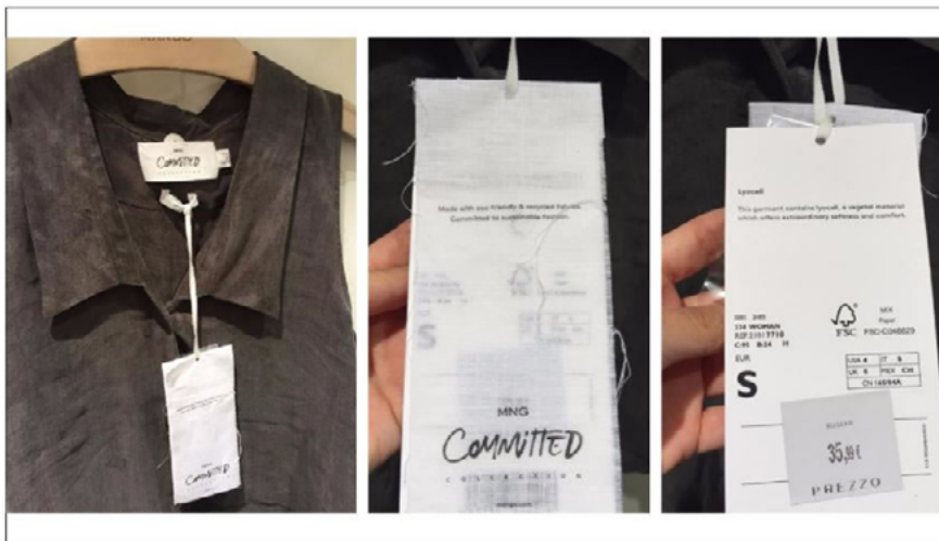
Imagen 1. Etiquetas en prenda Mango Committed

Mango tenía en su punto de venta físico prendas de la colección sostenible Mango Committed, al igual que en Zara, las prendas de colección sostenible no eran destacadas mediante cartelera. Se reconocía que la prenda pertenecía a la colección por las etiquetas colgadas en la prenda. En estas etiquetas se encontraba el logo de la colección en la parte inferior y en la parte superior se podía leer Made with friendly & recycled fabrics. Committed to sustainable fashion (Hecho con telas amigables y recicladas. Comprometido con la moda sostenible) (véase Imagen 1). A parte de las etiquetas colgadas de la prenda, no se encontró ningún cartel o modo de indicar que esa prenda estaba producida de forma sostenible.