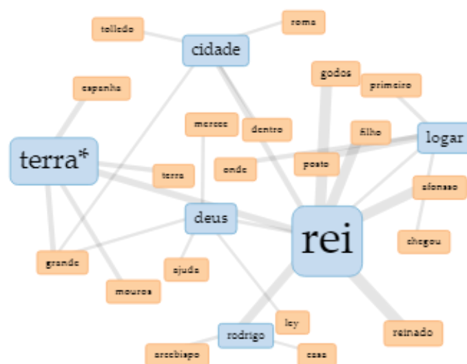
Figura 1. Ligações entre alguns dos termos mais frequentes no manuscrito L da Crónica de 1344

De facto, se atentarmos nas ligações entre as expressões mais frequentes (Figura 1), obtidas através da opção Links apresentada no software, podemos verificar como a terra parece ser a ponte entre os diferentes episódios: será pela terra que os exércitos cristãos lutam contra os mouros , esse inimigo plural que não aparece aqui personificado por nenhum soberano (califa, rei de Taifa ou outro) e será também na terra – a Espanha – que esses reis governam, herdeiros que eram dos godos e dos últimos reis da monarquia visigótica ( Rodrigo , principalmente, por ter sido o último a governar uma península unificada, mas também Ramiro , Ordonho e os vários Afonso da monarquia asturo-leonesa).