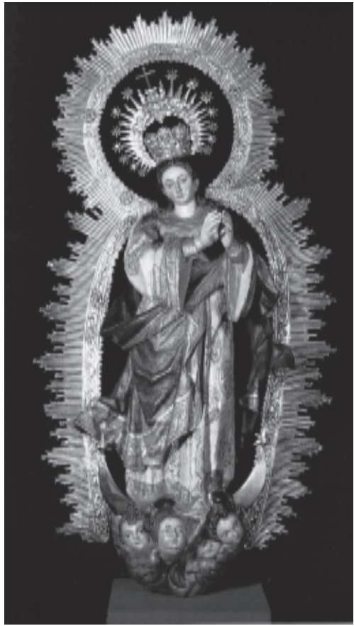
Inmaculada. Anónimo. Iglesia de Santa María Magdalena. Sevilla

Muy generoso fue también el legado realizado a la catedral de Sevilla por don Antonio de Vizarrón y Eguiarreta, que fue arzobis-