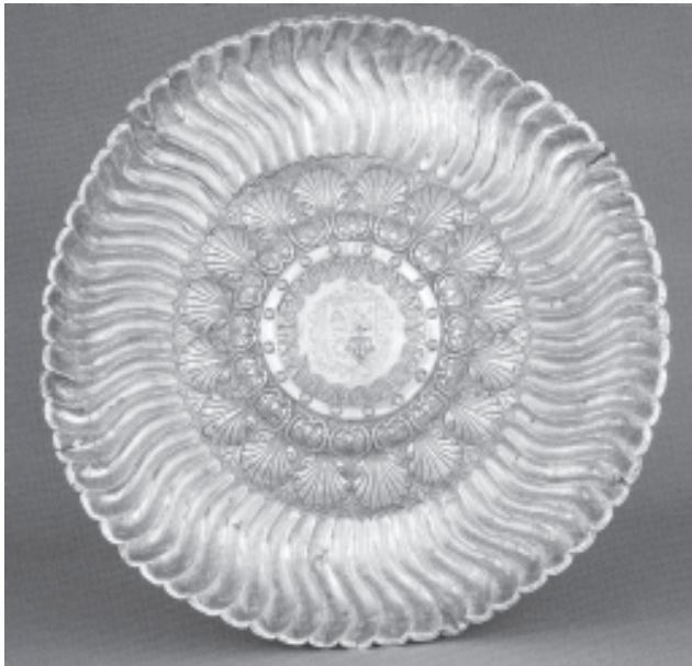
Bandeja. Iglesia de San Miguel. Cumbres Mayores (Huelva)

po de México y virrey de la Nueva España y anteriormente canónigo y arcediano del templo sevillano. En su testamento, redactado en 1744 señalaba «lo mucho que amé y deví a esa Santa Iglesia Patriarcal, mi Madre, por lo que no he podido menos que dejar una señal para después della, de mi gratitud y reconocimiento, por la honra que tuve en la silla de su arcedianato titular y por la confianza tan llana que por catorce años le debí dentro y fuera de España en el manejo de sus graves negocios». En razón