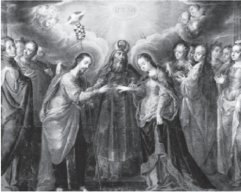
Los Desposorios de la Virgen. Cristóbal de Villalpando. Catedral. Jaén