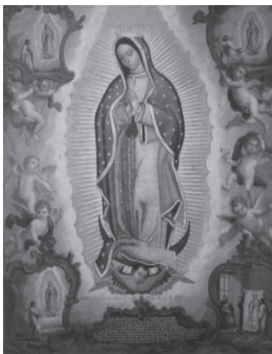
Virgen de Guadalupe. Francisco Antonio Vallejo. Colección particular. Sevilla