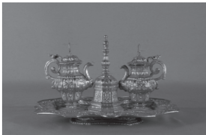
Vinajeras. Catedral. Sevilla