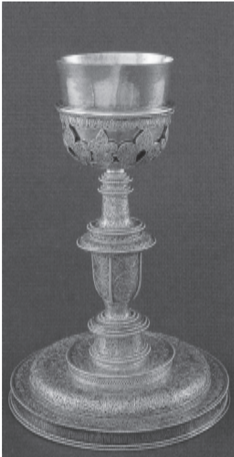
Cáliz. Ermita de Nuestra Señora de la Coronada. Calañas (Huelva)