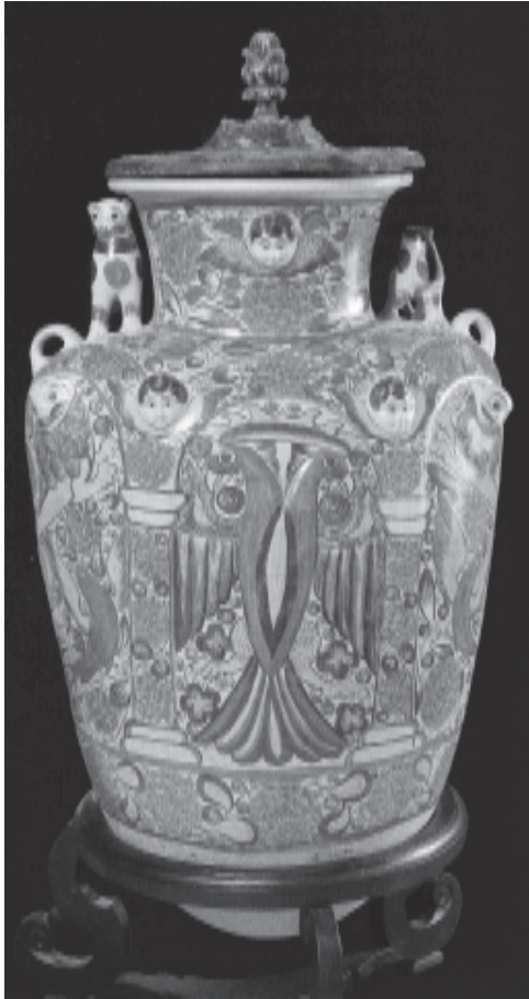
Tibor. Hermandad de Nuestra Señora del Valle. Iglesia de Santa Cruz. Écija (Sevilla)