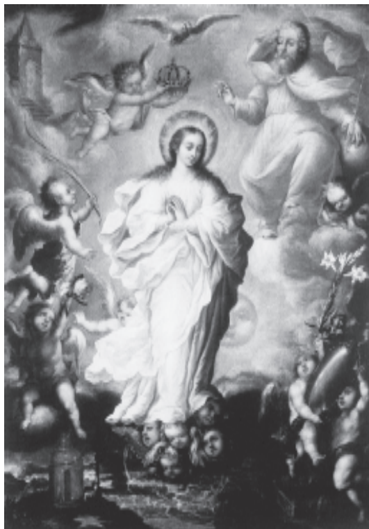
Tota Pulchra. Juan Correa. Museo Municipal. Antequera (Málaga)