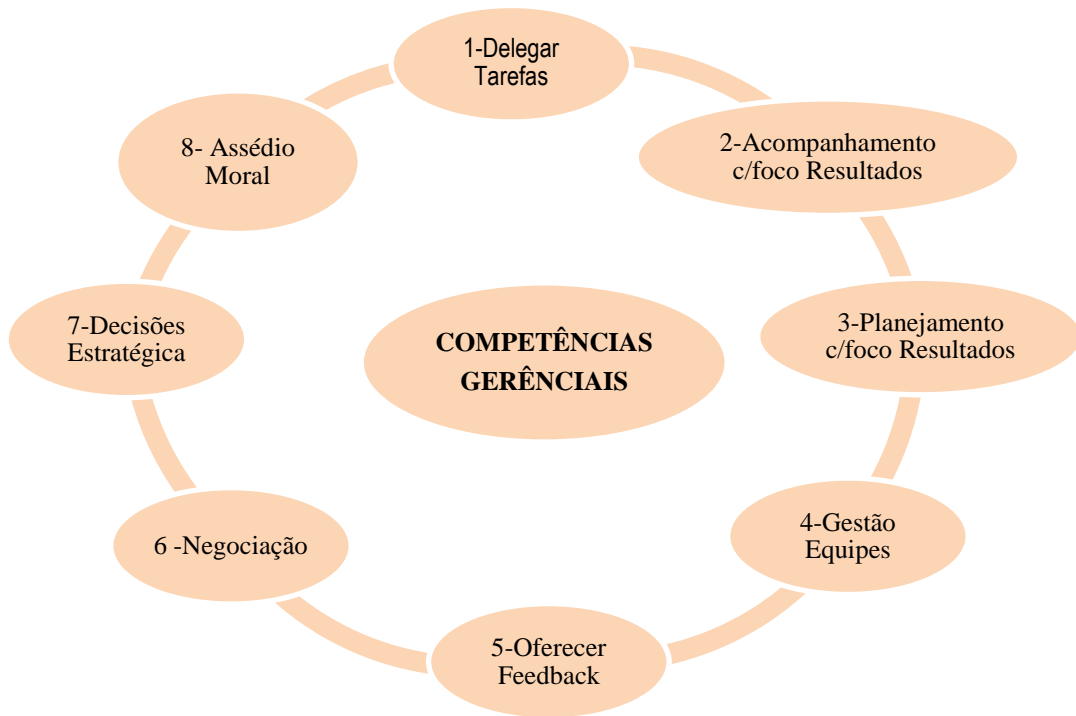
Figura 3 - Competências gerenciais com alta lacuna.

Fonte: Plano de Ações de Capacitação 2017-2018 (PAC)