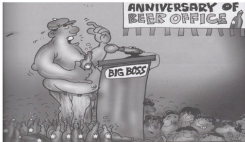
Gambar 8. Beer Office (Tema Waktu). Bali menjadi satu satunya provinsi tanpa larangan penjualan bir secara bebas. Oleh karena itu, citra bir juga melekat dengan wisata Bali.

Pada gambar 8 digambarkan seorang "Big Bos" bertubuh gemuk dengan perut yang buncit berpakaian dalam rangka ulang tahun "Beer Office". Di belakang podium terlihat jejeran botol-botol bir bintang.