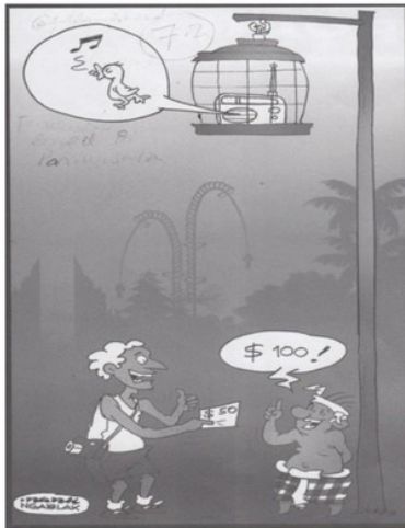
Gambar 2. Pedagang Burung (Tema Radio). Sumber: Bog-Bog Cartoon Magazine No.2. Vol 10 Tahun 2011

Pertumbuhan ekonomi pariwisata yang menjanjikan banyak dollar merubah perilaku masyarakat. Pada Gambar 2 digambarkan seorang turis mancanegara sedang menawarkan seekor burung yang mampu berkicau dengan merdu. Sang penjual burung kemudian mematok harga dua kali lipat mahalnyanya. Padahal pada sangkar hanya terlihat sebuah radio yang memainkan suara burung.