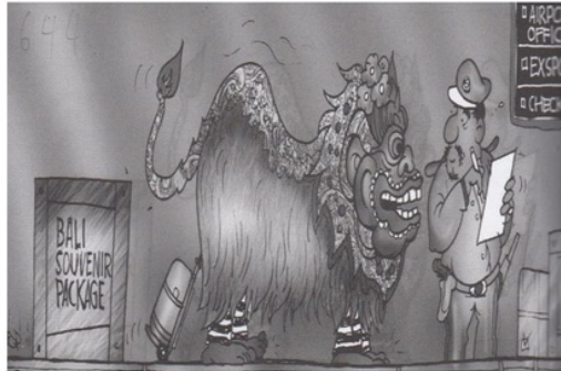
Gambar 4. Cop-fee Susu (Tema Globalisasi).

Penelitian Amminulah; peningkatan jumlah penduduk di Bali berkorelasi pada peningkatan angka kriminalitas.