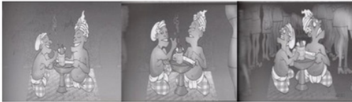
Gambar 5. Night Live Past Present Future.

Pada Gambar 5, digambarkan dua orang pria Bali sedang menikmati kegiatan malam mereka yang tenang dan damai dengan mengobrol, membaca lontar ditemani oleh kopi Bali. Seiring dengan berjalannya waktu, mereka tidak sendiri lagi. Ada orang-orang lain disekitar mereka. Sampai suatu saat orang-orang disekitar mereka sudah membentuk kerumunan. Kini mereka berada ditengah hiruk pikuk kegiatan malam orang-orang asing.