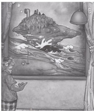
Gambar 6. Lukisan Tanah Lot.

Majalah Bog-Bog melihat kecenderungan berkurangnya hak-hak publik mengakses terhadap kawasan tertentu yang dahulu bebas dimasuki. Gambar 6 merupakan sebuah satire ironi pariwisata di Bali. Pada gambar ada terlihat seorang pria Bali sedang menatap sebuah lukisan Tanah Lot yang digambarkan dengan cerobong asap menyerupai kapal laut. Lukisan ini dibingkai dan ditutupi tirai bermotif dollar ($).