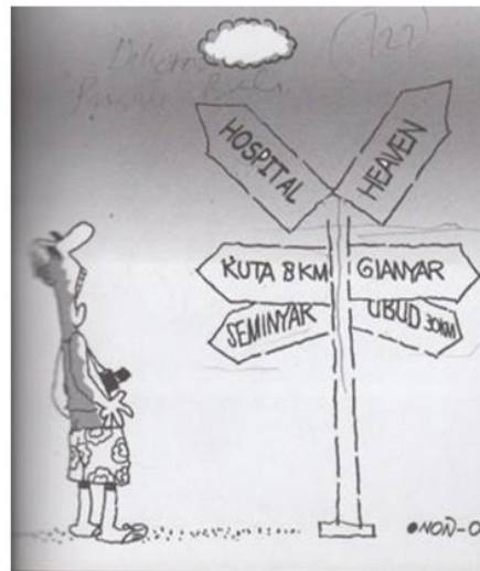
Gambar 7. Dikotomi Pariwisata Bali (Topik Rumah Sakit). Turis persepsi wilayah Bali Selatan sebagai pusat turistik sekuler dan Bali Timur sebagai wilayah turistik spiritual. Sumber: Bog-Bog Bali Cartoon Magazine No.6. Vol. 10, 2011

Gambar 7 menggambarkan seorang turis mancanegara yang sedang kebingungan membaca petunjuk arah di jalan. Pada papan petunjuk jalan terdapat dua arah, salah satu arah menuju Hospital (Rumah Sakit), merujuk daerah Kuta dan Seminyak. Arah yang lain menuju Heaven (Surga), merujuk daerah Gianyar dan Ubud.