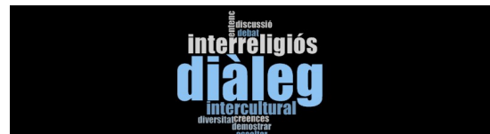
Gráfico 2. Marca de nube general con las narrativas significativas de la definición sobre la categoría diálogo interreligioso e intercultural en la Administración. Elaboración propia con base en información arrojada por el software Nvivo

“entiendo que el diálogo interreligioso puede ser una forma de diálogo intercultural, pero va un poco más allá (...) porque también pueden ser personas que sean de la misma cultura y que tengan religiones diferentes” (Ent 1, Grupo 1, ref. 1-2).