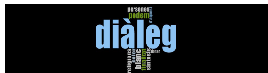
Gráfico 1. Marca de nube general con las narrativas significativas de la definición sobre la categoría diálogo interreligioso e intercultural en los expertos académicos. Elaboración propia con base en información arrojada por el software Nvivo 2

Existen diferentes niveles de diálogo interreligioso (desde los más institucionales hasta los de base ciudadana y social) y, como se ilustra en la marca de nube (Gráfico 1), en el relato aparecen matizados por su finalidad: el reconocimiento del otro y la síntesis que supone cambio, transformación y desarrollo.