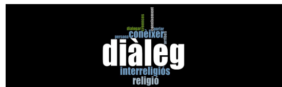
Gráfico 4. Marca de nube general con las narrativas significativas de la definición sobre la categoría diálogo interreligioso e intercultural en los profesionales de las entidades. Elaboración propia con base en información arrojada por el software Nvivo.

“Pero, cuando hacemos un esfuerzo de relación surge un contacto entre las partes y esto nos permite disfrutar de un conocimiento mutuo que facilita cualquier gestión y nos convierte en una sociedad más civilizada y organizada, sin dudarlo”. (Ent. 2, Grupo 2, ref.1).