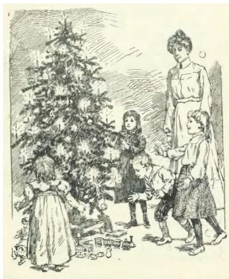
Ryc. 7. Świąteczne prezenty