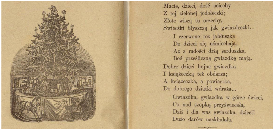
Ryc. 4. Piosenka o choince

Otulona w długi, śnieżny płaszcz, z kapturkiem zarzuconym na głowę obchodziła Gwiazdka w mroźny dzień grudniowy wszystkie domy, wszystkie mieszkania, gdzie tylko były dzieci, by przekonać się czy grzecznym zachowaniem się zasłużyły na jej dary w dzień wigilijny. O, bo dobre dzieci to takie, które są radością swych rodziców, nigdy nie kłamią, w porządku trzymają swe zabawki i książeczki, takie dzieci Gwiazdka kocha bardzo i cieszy się, gdy może ich nagrodzić. A bywa nieraz bardzo hojna. Każdemu chce dogodzić, każdemu dać, co najwięcej pragnie. Śliczne, strojne lalki od największej do najmniejszej, koniki kare, siwe, bułane, wózki, karety, tramwaje, pudełka z klockami, przeróżne gry, książeczki. Wszystko gotowa rozdać dla tym większej radości, dla większego uszczęśliwienia dzieci w dzień wigilijny 32 .