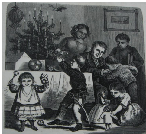
Ryc. 8. Zabawa