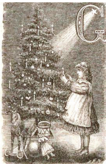
Ryc. 5. Kolenda

Podobne przedstawienie pięknie przyozdobionej choinki zostało umieszczone w „Wieczorach Rodzinnych. Tygodniku Ilustrowanym dla Dzieci” (1885). Zamyślona dziewczynka poprawia dekoracje choinkowe. Pod drzewkiem, na podłodze czekają na dzieci zabawki: dla chłopca jest tam konik na biegunach, szabelka, bębenek, natomiast na dziewczynkę czeka lalka, a także książeczka i piłka.