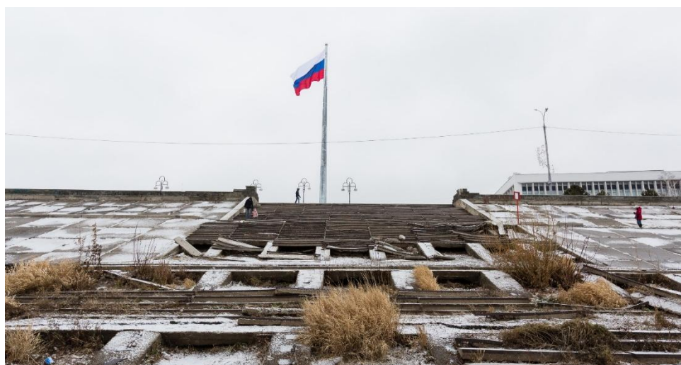
Рисунок 3 - Флагшток на пл.Ленина (г.Томск)

5. Первичные функции не вполне ясны с самого начала. Вторичные функции выражены неотчетливо и могут меняться. Пример: флагшток на площади им. Ленина в Томске. Вторичные функции в данном случае меняются в зависимости от отношения горожан к местной власти (рис.3).