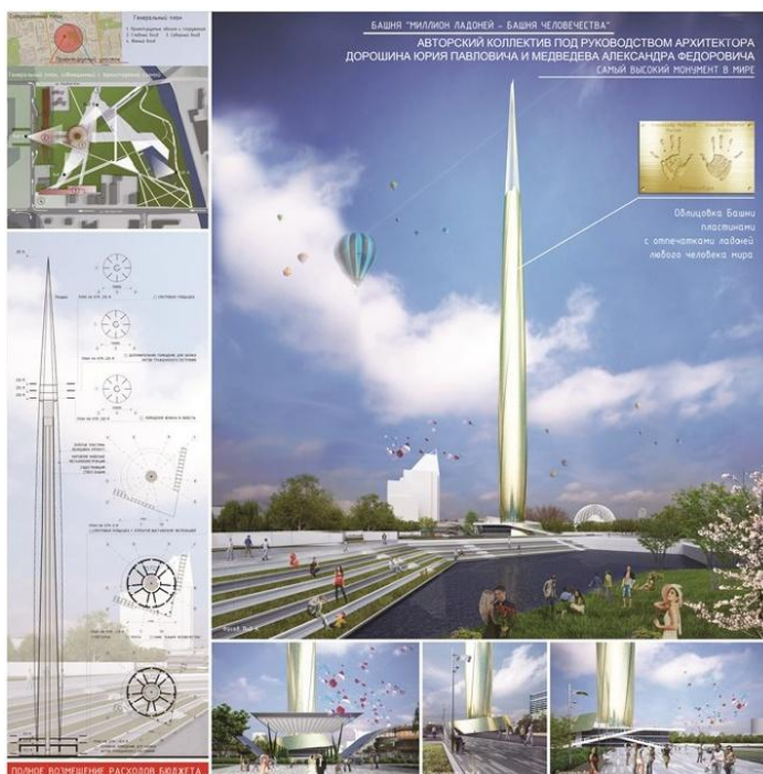
Рисунок 1 - Башня-монумент «Миллион ладоней» (г.Екатеринбург)

ем сайте представил ряд проектов, предложенных архитекторами города, от создания башни-монумента «Миллион ладоней - башня человечества» (рис.1) до возведения храма Святой Екатерины (рис.2) [4]. В условиях недостаточного финансирования из центра символы, формирующие уникальные образы российских городов, подвергаются разрушительному воздействию со стороны местной власти или представителей бизнеса.