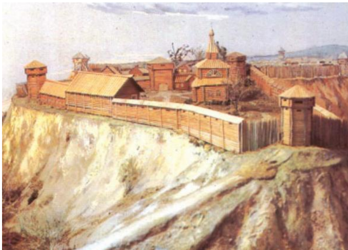
Рисунок 4 - Томский острог

Город Томск возник как форпост продвижения русских в Сибирь и, следовательно, был городом военных (казаков и служилых людей), главными задачами которых было завоевание новых земель, приведение жителей под присягу царю и взимание с них дани. Благодаря реконструкции острога томскими археологами, стало известно, что его окружали массивные стены и высокие (более 20 метров) башни, что, вероятно, должно было внушать страх окружавшим его врагам.