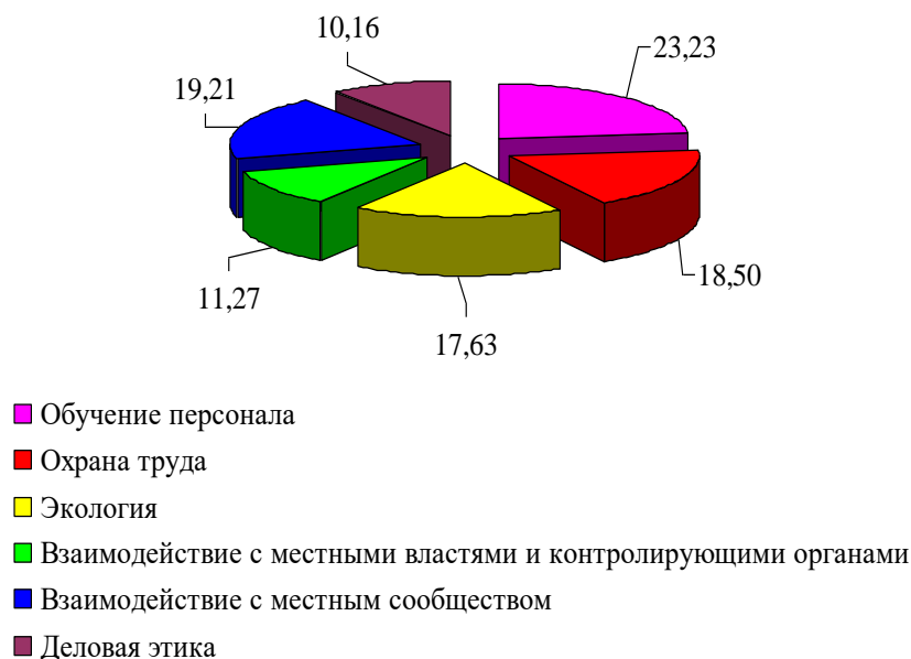
Рисунок 3 – Структура плановых затрат ООО «Изыскательская партия» на программы социальной ответственности в 2019 год, %

Из Таблица 17 видно, что общая сумма финансирования социальных программ составит на 2019 год 54 111 тыс. сумм, из которых большую часть составят затраты на программы «Обучение персонала», «Охрана труда» и «Взаимодействие с местным сообществом» – рисунок 3.