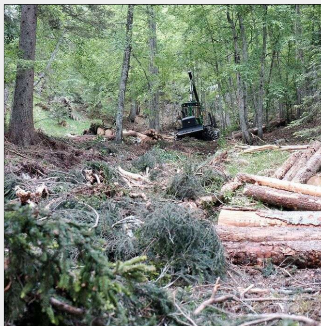
Fig. 8 - Disposizione della ramaglia lungo una pista forestale temporanea come buona pratica per contenere il compattamento del suolo a seguito del transito di mezzi forestali.