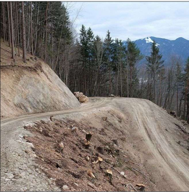
Fig. 3 - Tornante di nuova realizzazione per strada adatta al transito di autotreni (Carinzia, Austria).