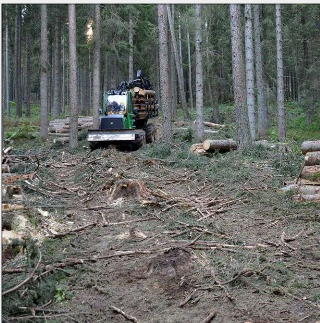
Fig. 7 - Pista forestale temporanea utilizzata esclusivamente per le attività in corso di esbosco di legname.

Allo stato attuale, le definizioni presenti nelle Leggi regionali o provinciali per le diverse tipologie di infrastrutture risultano diverse tra loro. Un'armonizzazione dei principali termini usati per i diversi elementi della viabilità e delle opere connesse appare fondamentale per evitare fraintendimenti nella gestione, pianificazione, progettazione e