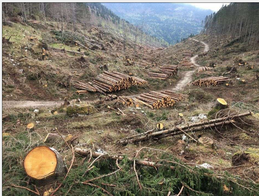
Fig. 1 - Strada forestale di recente costruzione (2017-2018) e prontamente utilizzata per il recupero del legname danneggiato a seguito della tempesta Vaia di fine ottobre 2018. La presenza della strada ha limitato di fatto la lunghezza delle piste forestali di esbosco, contenendo il fenomeno di erosione e il rischio compattamento del suolo (Altopiano dei Sette Comuni, Veneto).

no delle foreste danneggiate da eventi abiotici e biotici (Fig. 1).