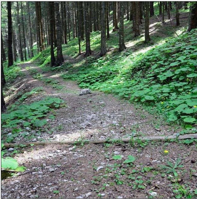
Fig. 6 - Pista forestale principale a fondo naturale realizzata con un minimo intervento di stabilizzazione e regolazione delle acque.

terventi di stabilizzazione e regimazione delle acque (Fig. 6). All'interno di queste due macro-categorie vengono poi definite diverse tipologie di viabilità, camionabili e trattorabili nel caso delle strade (rete viabile principale) e principali e secondarie nel caso delle piste (rete viabile secondaria).