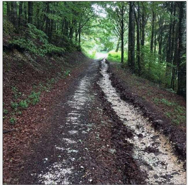
Fig. 4 - Strada forestale con iniziale erosione del piano viario a seguito di mancanza di manutenzione dei sistemi di deflusso delle acque meteoriche (Altopiano dei Sette Comuni, Veneto).

2010, Laschi et al. 2016), nonché opportuni dettagli tecnici e di progettazione finalizzati a contenere gli impatti diretti e indiretti. Ne consegue che la riduzione dei rischi ambientali connessi all'apertura di infrastrutture forestali richiede l'adozione sia di misure preventive, nelle fasi di pianificazione, progettazione e costruzione, sia protettive, in fase di manutenzione e adeguamento (Lugo & Gućinski 2000). Le misure preventive e di protezione sono da preferire a quelle di ripristino, eseguite a seguito di problemi o dissesti, che si rivelano spesso assai più costose sia in termini economici sia ambientali. La principale forma di prevenzione è rappresentata quindi da un'attenta valutazione dell'opportunità di costruire nuove infrastrutture (Cavalli et al. 2010, Hayati et al. 2013, Picchio et al. 2018).