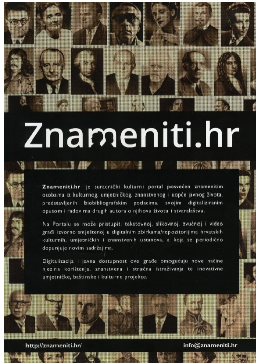
Promotivni letak za Znameniti.hr tiskan početkom 2019.

skih institucija omogućuje daljnji razvoj portala. Sredstva za digitalizaciju i objavu nove građe osiguravaju se dvojako, ne samo kroz suradničke, već i u okviru samostalnih projekata.