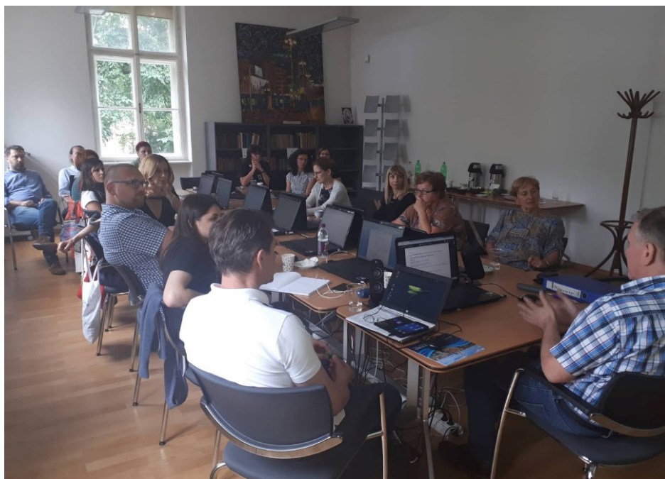
4. radionica u okviru CFDI projekta, Zagreb, 2. srpnja 2018.

suradnici na projektu. Na prvoj dvodnevnoj radionici (28–29. XI. 2017) određene su metode suradnje između znanstvenih i kulturnih institucija koje sudjeluju u projektu. Središnja problematika druge radionice (12–14. II. 2018), uz već pokrenutu prvu inačicu tematskoga portala EminentPeople.eu, bila su etička pitanja te autorska i srodna prava i preporuke. Na trećoj radionici (10–11. IV. 2018) testirala se prva verzija tematskoga portala, ispitivanjem profila metapodataka za pojedine vrste građe u različitim institucijama te isprobavanjem unosa metapodataka uz korištenje normative baze NSK u Zagrebu za osobe, korporativna tijela i subjekte, a na kraju je odabran i popis osoba koji će se objaviti na tematskom portalu do kraja projekta. Na četvrtoj i posljednjoj u nizu radionica (2–3. VII. 2018) raspravljalo se, među ostalim, o dizajnu i formatu portala, njegovu uredništvu i drugim sitnim, ali vrlo važnim detaljima vezanima uz njegov konačan izgled i funkcionalnost. Pokazna verzija portala pokrenuta je u rujnu 2018. godine na adresi http://eminentpeople.eu (Juričić 2018).