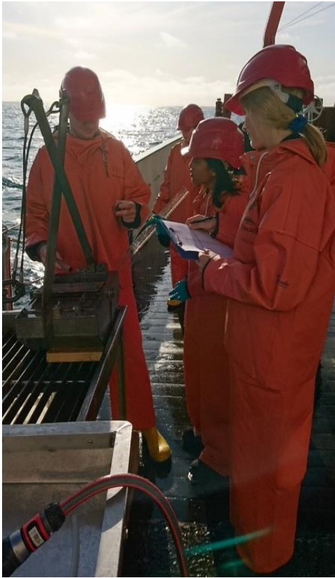
Bild 5: Erste Begutachtung und Protokollierung des Inhalts des van Veen-Greifers.