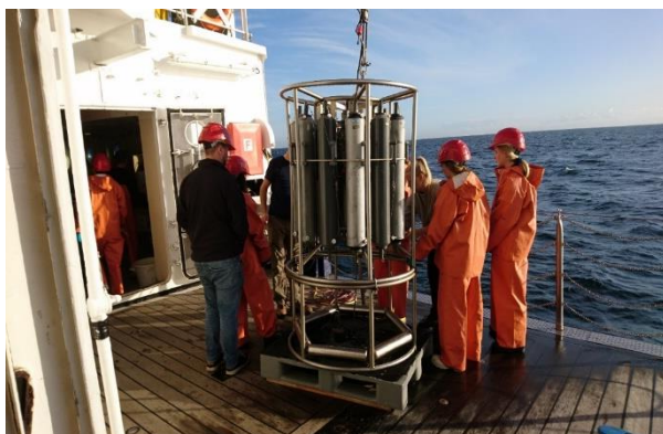
Bild 3: Demonstration von Funktion und Bedienung des Kranzwasserschöpfers