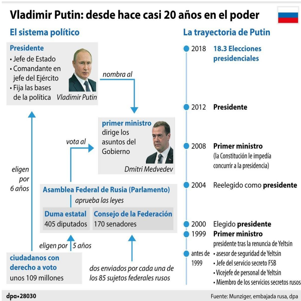
Imagen I: Trayectoria histórica de Vladimir Putin en la Federación de Rusia

Elaborado por: Diario digital Clarín Mundo. 2018. https://www.clarin.com/mundo/vladimir-putin-ineludible-lider-rusia_0_ryxghkdFf.html