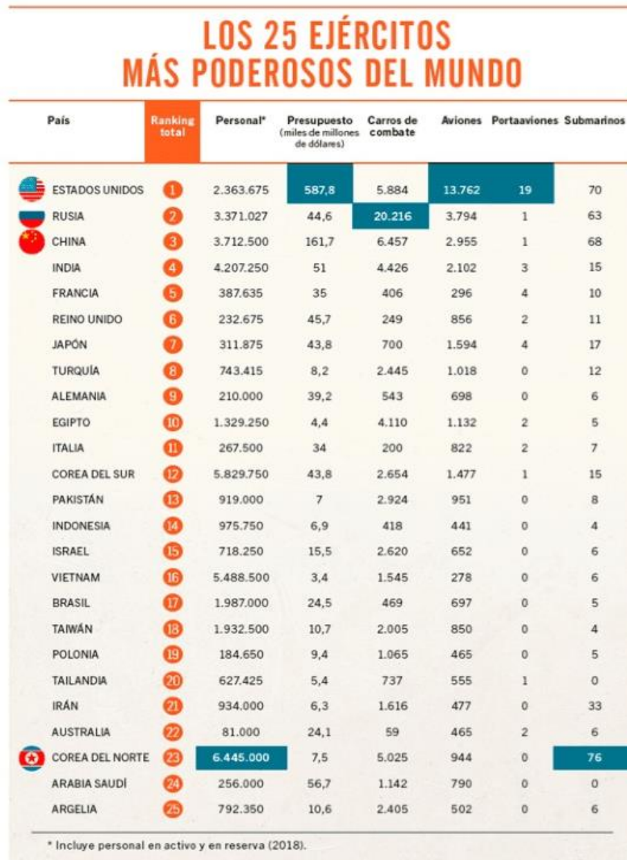
Imagen II: Los 25 ejércitos más poderosos del mundo