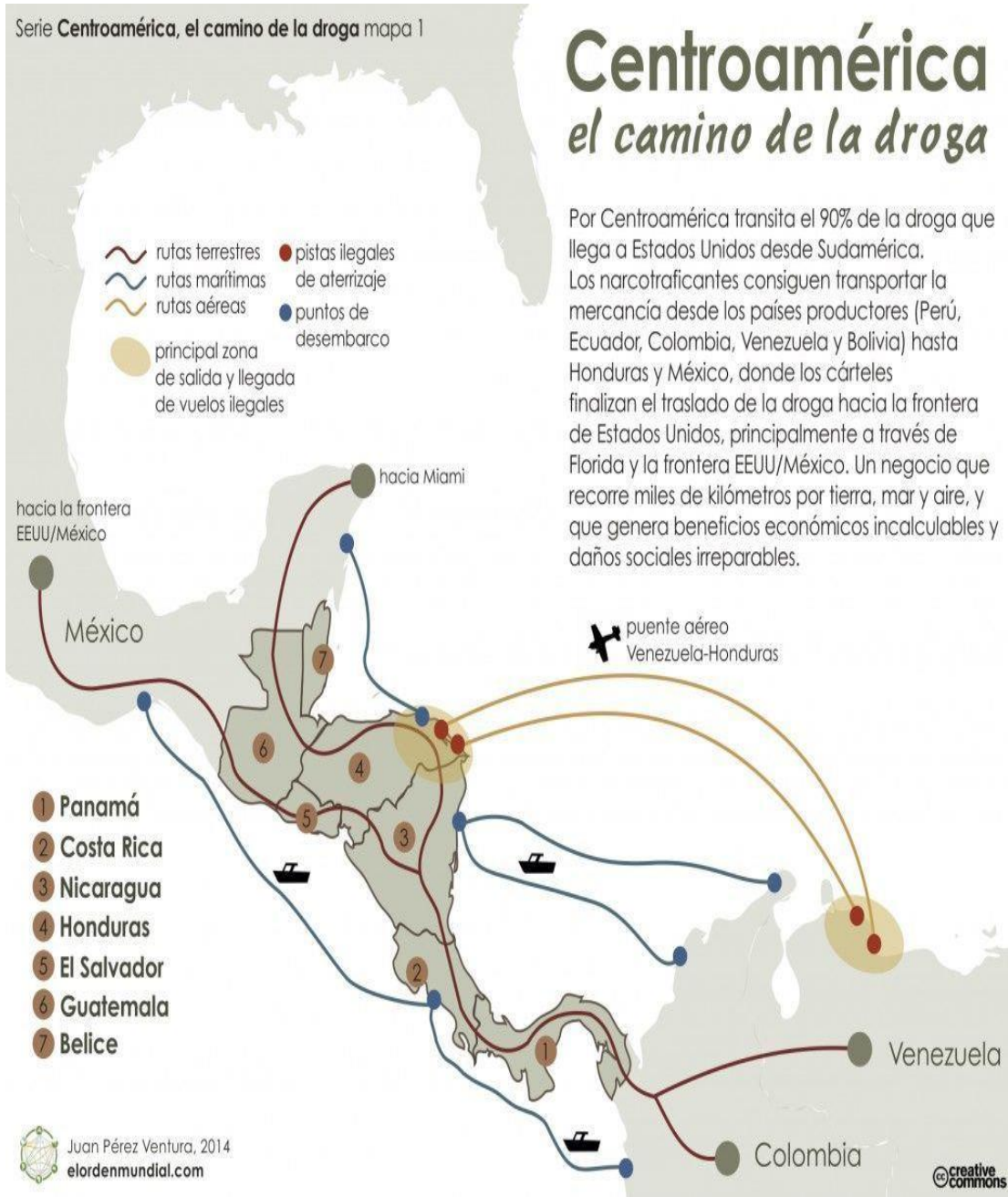
Imagen III: Centroamérica el camino de las drogas