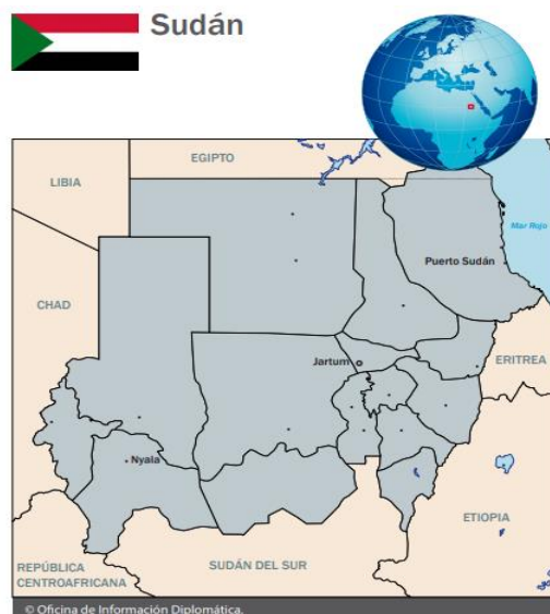
Mapa 1.7 – Mapa político de la República de Sudán

El mandato del presidente tiene una duración de entre 5 y 10 años, aunque el actual presidente Omar Al Bashir ha estado en el poder desde 1989, se han realizado desde entonces cinco elecciones presidenciales para reconfirmar su hegemonía en el cargo, siendo la última en abril del 2015. 13