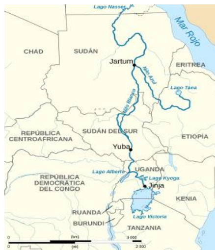
Mapa 1.2 – Recorrido del Nilo Blanco

Se presentan mapas que detallan los dos nacimientos y recorridos del río Nilo, así como el Delta en su desembocadura en el mar Mediterráneo.