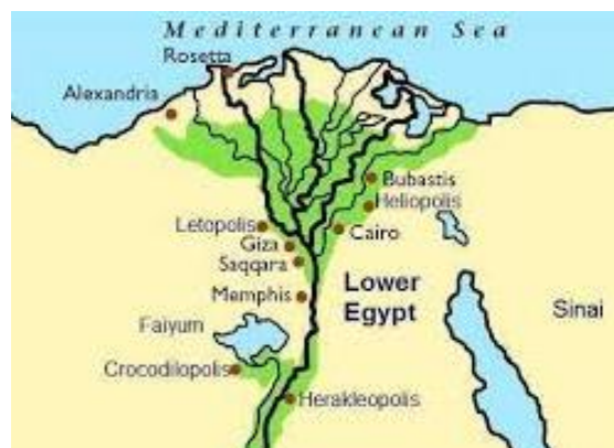
Mapa 1.4 Delta del Nilo

Por otro lado, en Egipto, se encuentra el Delta del Río Nilo.