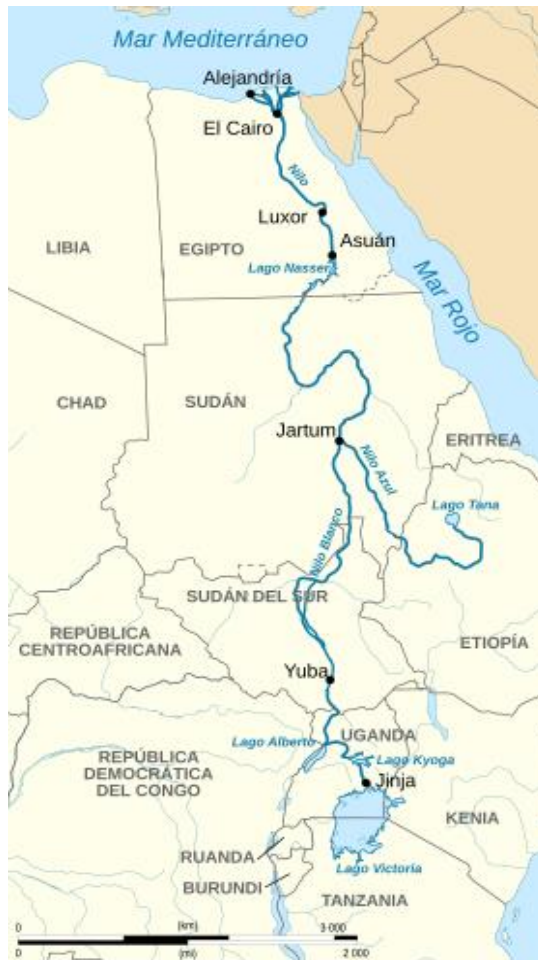
Mapa 1 – Recorrido del río Nilo