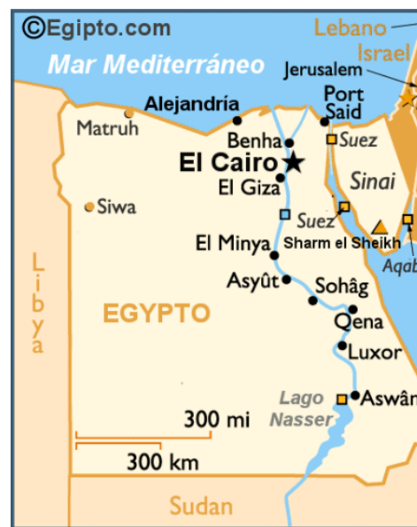
Mapa 1. 5 – Mapa político de la República Árabe de Egipto

La forma de gobierno es una República semipresidencialista y unicameral. El mandato del presidente es de cuatro años, con posibilidad de reelección,