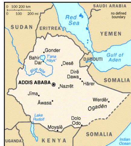
Mapa 1.6 – Mapa político de la República Democrática Federal de Etiopía

Las etnias principales son “los Sidáma, Wolaitta, Gurage o Gamo, y bajando hacia el extremo sur, nos encontramos con un mundo totalmente tribal y