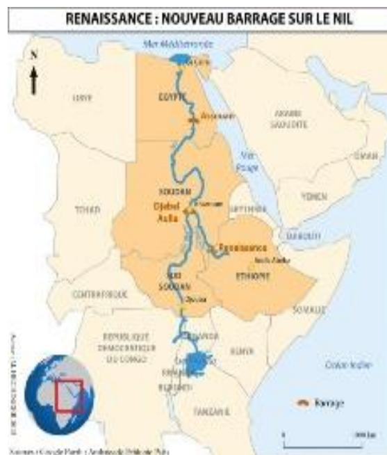
Mapa 2.1 Mapa de presas hidroeléctricas en el río Nilo

Se presenta a continuación un mapa que muestra el recorrido del Nilo, sus principales afluentes, el Nilo Blanco y el Nilo Azul, así como las dos represas hidroeléctricas que se han construido en su cauce, además de la tercera que está actualmente en construcción, la presa del Renacimiento etíope.