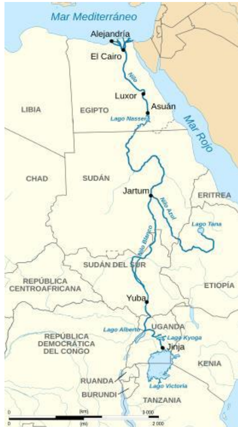
Mapa 1.1 – Recorrido del río Nilo