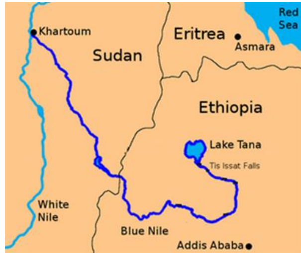
Mapa 2 – Recorrido del Nilo Azul