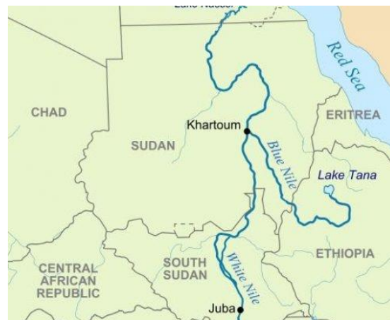
Mapa 1.3 Recorrido del Nilo Azul

El mapa 1.2 muestra el recorrido del Nilo Blanco, el cual nace en el Lago Victoria que comparten Tanzania, Uganda y Kenia. El río discurre a través de las montañas en Uganda, se alimenta del Lago Alberto (fronterizo con la República Democrática del Congo) y el Lago Kyoga, sube con dirección norte hacia Sudán del Sur y Sudán donde cruza su territorio y se une en su capital al Nilo azul para a partir de ese momento formar el Nilo.