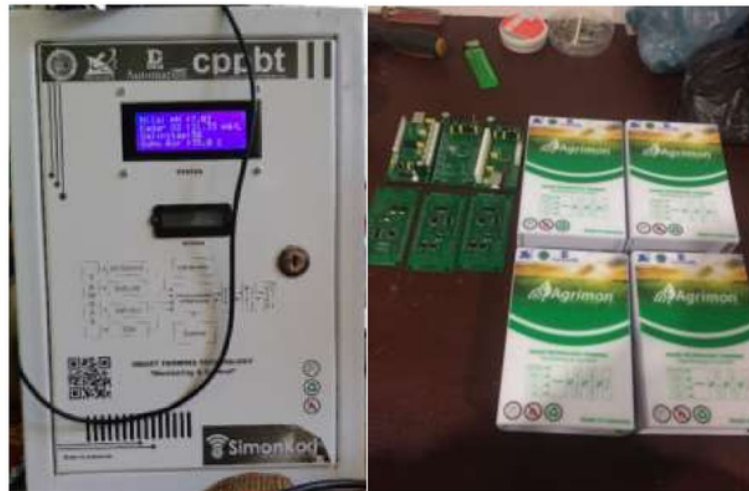
Gambar 4. Aplikasi teknologi Agrimon