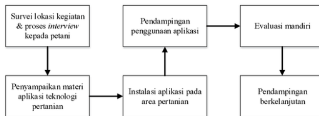
Gambar 1. Proses kegiatan pemberdayaan petani

Pada kegiatan yang akan dilaksanakan kepada masyarakat utamanya para petani yang beraktifitas di area persawahan dan bercocoktanam padi. Hal ini didasari dari masalah utama yakni hasil padi yang perlu dijaga kualitas hasil panennya, sebab merupakan penghasil beras yang menjadi bahan utama pangan manusia. Solusi yang diberikan melalui diseminasi teknologi tepat guna Agrimon ( Agriculture Monitoring ). Kegiatan pemberdayaan petani-petani desa argorejo sedayu dilaksanakan melalui beberapa tahap kegiatan. Kegiatan meliputi pengenalan teknologi tepat guna bagi pertanian juga adanya umpan balik bagi aplikasi yang dikembangkan. Langkah-langkah kegiatan ditunjukkan pada Gambar 1.