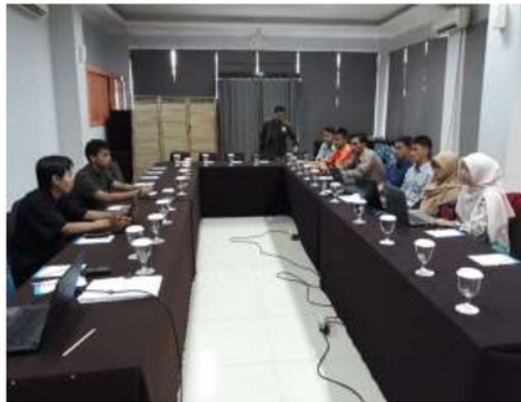
Gambar 3. Diskusi persiapan tim dan survei