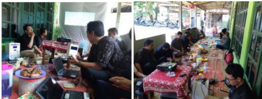
Gambar 5. Sosialisasi dan pemaparan teknologi Agrimon pada kelompok tani desa Argorejo

Gambar 4 adalah produk agrimon yang dikembangkan dengan orientasi skala produk terapan yang dapat langsung diimplementasikan pada lokasi pertanian. Selanjutnya pada