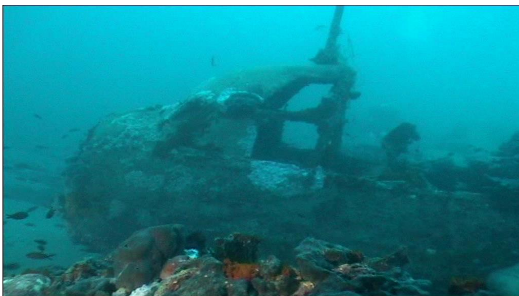
Fig.2. Relitto del bombardiere tedesco Junker JU 88. Santa Caterina di Nardò, -32 metri.

Relitti Rinati propone, in dettaglio, di attivare le indagini su undici relitti.