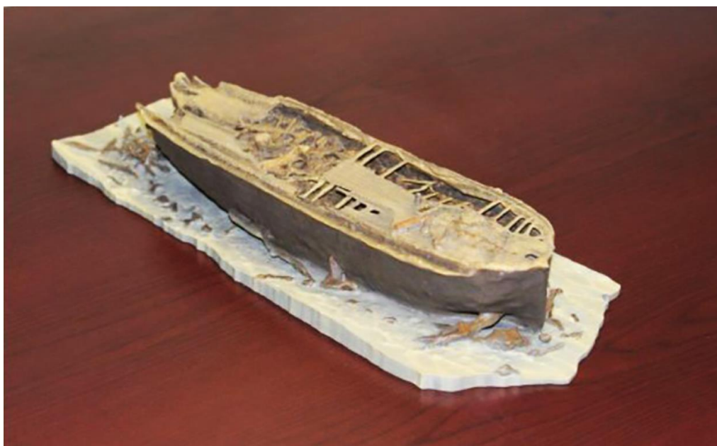
Fig.5. Produzione in stampa 3d del relitto della HMS Herebus.

Il passaggio successivo è la produzione di modelli reali in scala attraverso stampanti tridimensionali o strumentazioni affini.