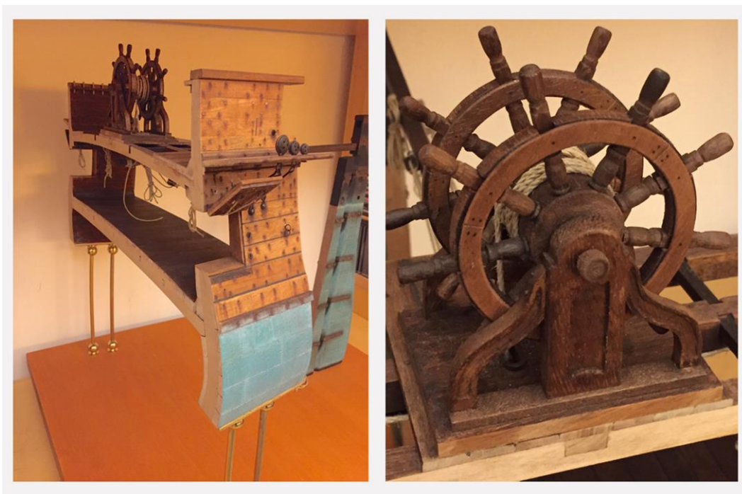
Fig.6. Sezione maestra con apparato di governo funzionante della fregata francese da 18 libbre Vènus. Sinistra: spaccato della nave; destra: sistema della doppia ruota del timone. Realizzazione in modellismo d'arsenale. Foto e modello dell'Autore.

Tutti i materiali così ottenuti, inclusa una banca dati multimediale ad accesso controllato, saranno affiancati da materiali e fonti d'archivio reperite e rese disponibili alla fruizione comune attraverso l'apertura di strutture predisposte a tale scopo.