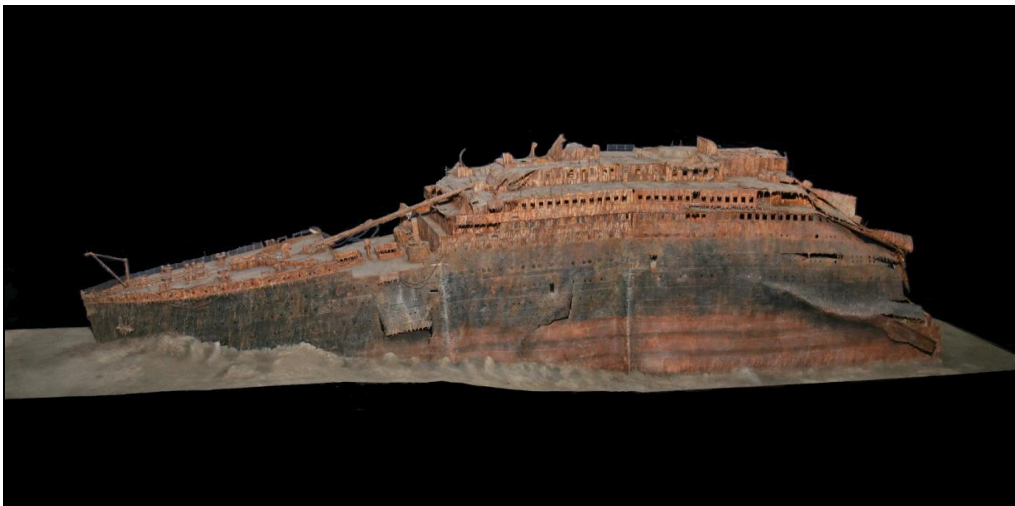
Fig.3. Creazione in realtà amplificata del relitto del Titanic a partire dai dati numerici generati da HF sidescan sonar .

Il progetto prevede, per ogni relitto, la raccolta dati che, attraverso strumentazione sonora, restituisca informazioni esportabili e gestibili in ambiente digitale per la produzione di modelli virtuali.