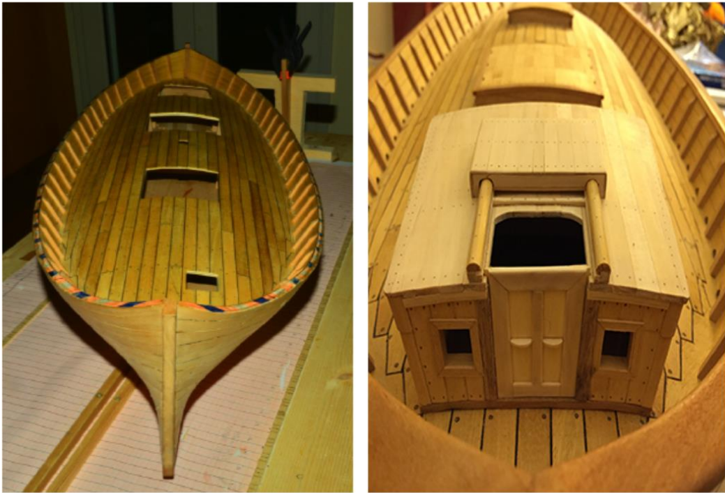
Fig.7. Ricostruzione con la tecnica del modellismo d'arsenale di un leudo. Sinistra: scafo completo; destra: osteriggio del comandante. Foto e modello dell'Autore.

Diorami, materiali didattici, scientifici, banche dati costituiranno il necessario supporto a completamento di questo progetto dal sicuro successo, come simili esperienze, benché parziali rispetto all'architettura presentata da Relitti Rinati, dimostrano dall'analisi effettuata in ambito panmediterraneo.