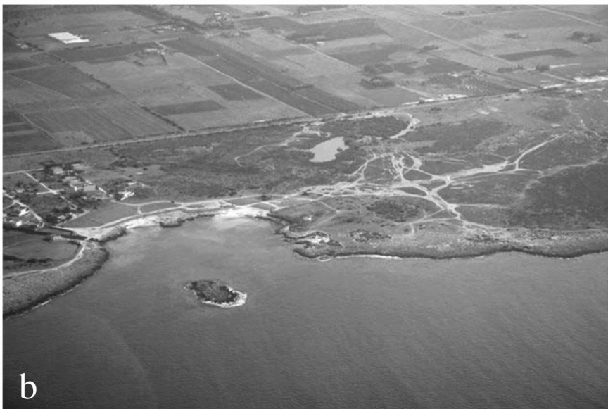
Figg. 4a, b Vedute aeree del sito in esame. Con la freccia nera in a è indicato il lucernario di accesso ad un tratto dei cunicoli sotterranei (per i dettagli si legga il testo).