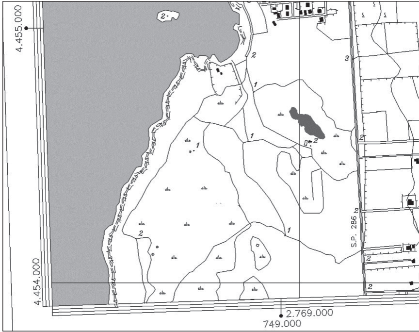
Fig. 1 - Estratto dalla sezione n° 511/60 (S. Isidoro) della Carta Tecnica Provinciale Numerica (CTPN) della Provincia di Lecce. È evidenziata, nell'entroterra, la Palude del Capitano, sito di studio del presente lavoro.

Considerando che l'area geografica in analisi non raggiunge quote altimetriche superiori ai 3 m sul livello marino, una lettura stratigrafica dei depositi in giacitura originaria non è possibile per insufficiente esposizione e per l'assenza di approfondimenti creati da un carsismo di superficie particolarmente sviluppato. Lo stesso sito in esame nel presente lavoro non è un fenomeno superficiale, bensì un fenomeno carsico di genesi "profonda" e solo oggi a causa dei fenomeni di crollo più recenti, le sue manifestazioni appaiono superficiali.