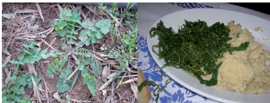
Fig. 3 - Grespino comune ( Sonchus oleraceus L.) – pietanza realizzata con grespini e pura di fave