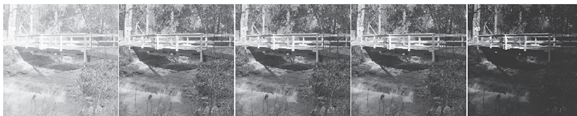
Рис. 1. Тестовое изображение bridge после гамма-коррекции яркости при гамма равном 0.25, 0.75, 1 (совпадает с исходным изображением), 1.25 и 3.3, соответственно