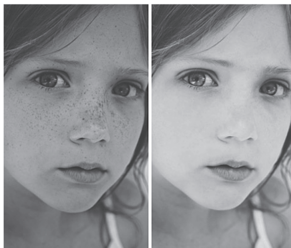
Рис. 7. Пример портрета и его улучшенной копии

Изображения f11 и f22 очень похожи, но получены с использованием разных фокусных расстояний ( f11 и f22 ). Отличия слегка заметны в резкости деталей заднего плана. Подобно визуальным оценкам сравнительного качества этих изображений, оценки полученные исследуемыми мера разделались.