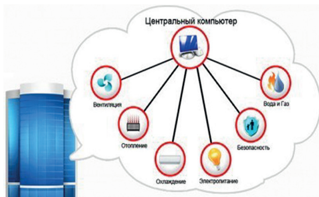
Рис. 2. Система управления зданием BMS (Building Management System) Fig. 2. Building management system BMS (Building Management System)