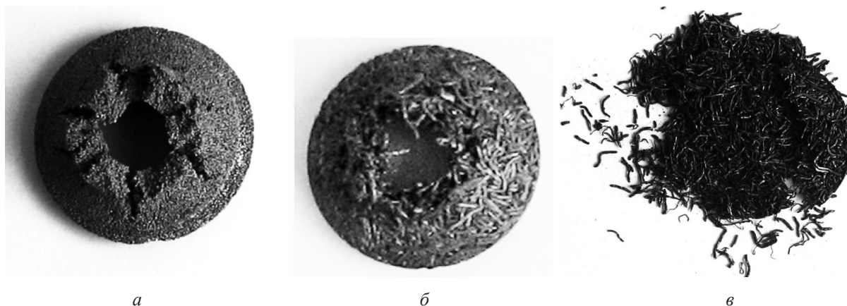
Рис. 3. Внешний вид образцов после механических испытаний: a – образец пористого порошкового материала из порошка оловянно-фосфористой бронзы, б – образец пористого волокнутого материала, спеченный при 1050 °С, в – образец пористого волокнутого материала, спеченный при 950 °С

Анализ полученных результатов показывает, что при практически одинаковых структурных и гидродинамических свойствах пористых волокнутых материалов они имеют существенную разницу в усилии разрушения: образец, изготовленный при 1050 °С, характеризуется большим (более чем на 34%) усилии разрушения, что свидетельствует о лучшем качестве спекания. Сравнение внешнего вида образцов (рис. 3) наглядно подтверждает данный вывод и указывает на различный характер разрушения. На рисунке приведен также внешний вид испытанного на том же устройстве образца пористого порошкового материала, изготовленного из порошка оловянно-фосфористой бронзы и имеющего высокий уровень механических свойств для пористых материалов фильтрующего назначения ( \sigma_{и} = 50 МПа). Его сравнение с разрушенным образцом пористого волокнутого материала, спеченного при 1050 °С, свидетельствует об идентичном характере разрушения.