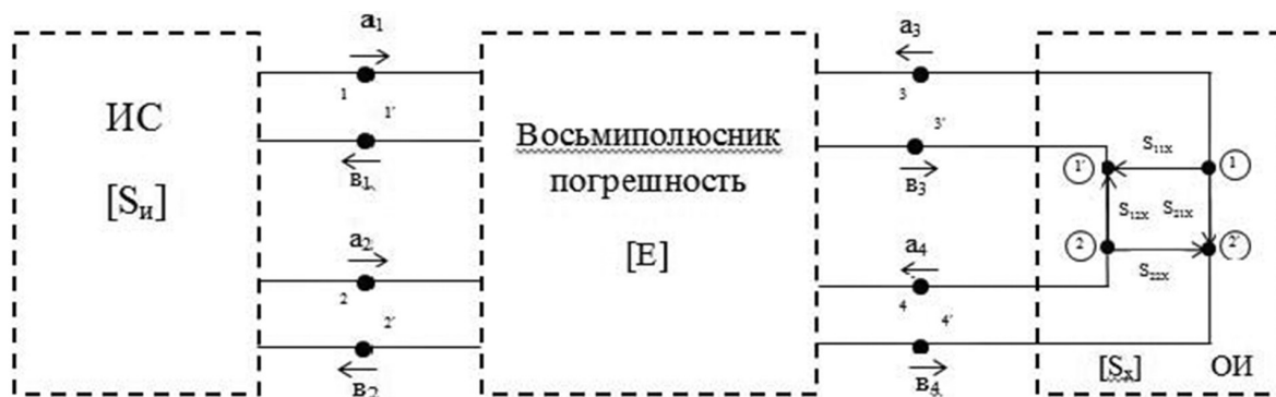
Рис. 1. Полная математическая модель измерения для объекта измерения в виде четырехполюсника Fig. 1. A complete mathematical measurement model for a measurement object in the form of a four-terminal network