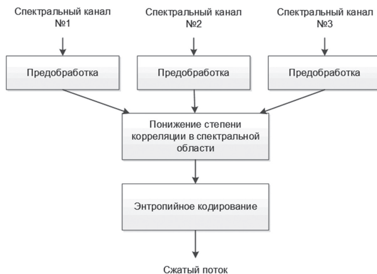
Рис. 3. Алгоритм сжатия гиперспектральных данных