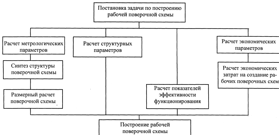
Рис. 2. Алгоритм разработки рабочих поверочных схем на основе принципа многокритериальности

Алгоритм включает разработку поверочной схемы (плоской или одновекторной системы передачи размера единицы физической величины), отражающей порядок передачи размера единицы физической величины от эталона к рабочим средствам измерений, и создание рабочей поверочной схемы (модели пространственной системы передачи размера единицы физической величины, реально функционирующей на практике).