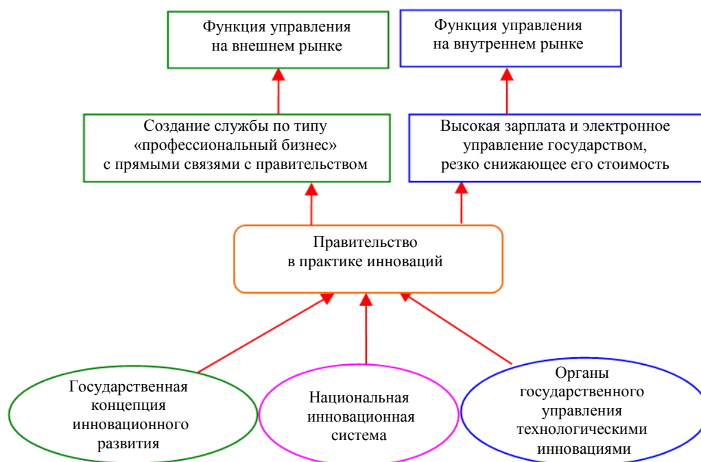
Рис. 3. Структурная схема «Правительство в практике инноваций», опыт индустриального парка Сучжоу Fig. 3. "Government in Innovation Practical Activity" block diagram, experience of industrial Park "Suzhou"