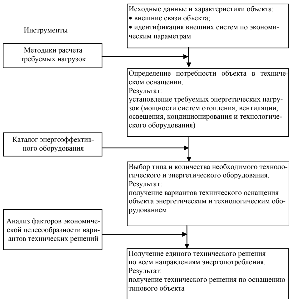
Рис. 2. Алгоритм разработки проектных решений

При решении задачи унификации исследуемых объектов и разработке типовых инновационных решений предлагается использовать следующий алгоритм (рис. 2).