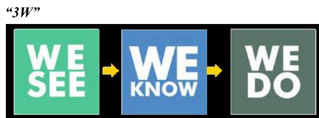
Gambar 2. Taktik Kampanye Vaksinasi Campak Rubella

Penelitian ini juga menganggap bahwa ada kekurangan yang terjadi dalam kampanye dan pelaksanaan vaksinasi campak rubella, sehingga ada beberapa hal yang harus diperbaiki untuk bagaimana mengefisiensi aktivitas berikutnya agar tidak terjadi pro-kontra atau kesalah pahaman dalam kampanye dimaksud. Sehingga kalimat efektif yang dapat membantu mengedukasi masyarakat sebelum adanya realisasi vaksinasi adalah dengan memperkenalkan sebuah program “VAKSINASI: AMAN, HALAL, BERMANFAAT”, diperlukan strategi yang mencakup alasan mengapa seseorang perlu melakukan sesuatu (teori atribusi), dalam konteks ini adalah melakukan Vaksinasi Virus Rubella, yang jika strategi tersebut diurutkan akan membentuk urutan sebagai berikut :