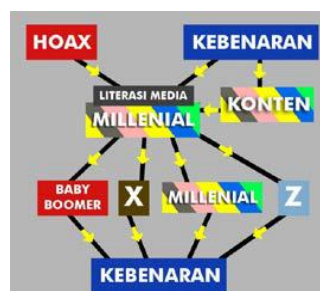
Gambar 1. Alur Retribusi terkait Vaksinasi

Terkait dengan kampanye vaksinasi campak rubella adalah sebuah pemahaman konotasi yang terbranding oleh bagaimana pesan disampaikan oleh media, secara baik atau tidak. Dalam artian hoax atau kebenaran yang realitas terjadi. Semua kembali pada bagaimana masyarakat mampu menelaah apa yang harusnya dipahami untuk dijadikan acuan dalam bersikap dan menentang sesuatu hal yang mungkin saja keliru. Millenial yang dimaksud adalah masyarakat pada umumnya yang sudah terkoneksi