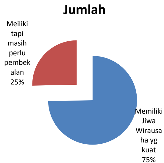
Gambar 2. Pengelompokan Kepemilikan Jiwa Kewirausahaan Responden

Dikaitkan dengan kriteria dari Schmidt, dari hasil tersebut diperoleh pengelompokan sebagai berikut :