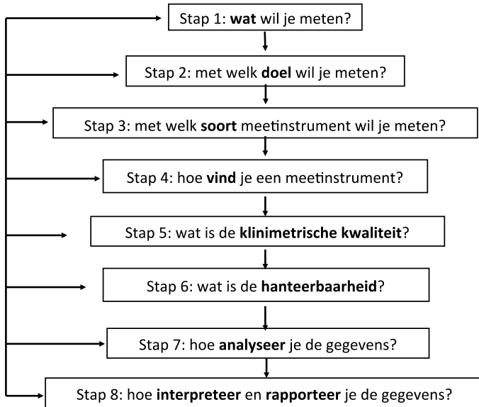
Figuur 2: Stappenplan voor het selecteren en gebruiken van meetinstrumenten (16,18)

Ik ga het stappenplan nu kort met u doorlopen. De te nemen stappen moet u niet los van elkaar zien, het is eigenlijk een cyclisch proces want de stappen hangen onderling sterk samen.