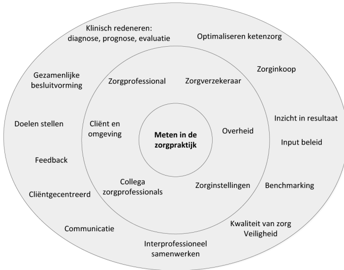
Figuur 1. Doelen van het gebruik van meetinstrumenten in de dagelijkse zorgpraktijk (16).

Naast het gebruik in het primaire zorgproces voor individuele cliënten worden de collectieve resultaten van meten ook gebruikt als indicatoren voor kwaliteit van zorg en als stuurinformatie. Ziekenhuizen, zorgverzekeraars en het Kwaliteitsinstituut (Zorginstituut Nederland) zetten zich momenteel dan ook sterk in op het gebruik van de eerder genoemde PROMs om inzicht te krijgen in de resultaten van zorg.