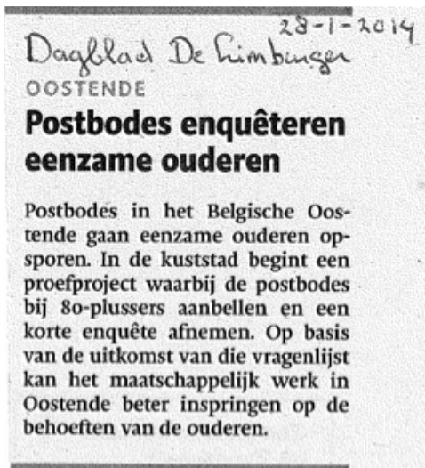
Figuur 5. Voorbeeld van een creatieve vorm van meten bij onze zuiderburen.

Het inzetten van meetinstrumenten in de dagelijkse praktijk vraagt ook om creativiteit en 'out of the box' denken. Zo kwam ik begin dit jaar het volgende bericht in Dagblad De Limburger tegen over een innovatieve strategie van onze zuiderburen om postbodes bij 80-plussers te laten aanbellen en een korte enquête af te nemen om eenzame ouderen op te sporen (Figuur 5).