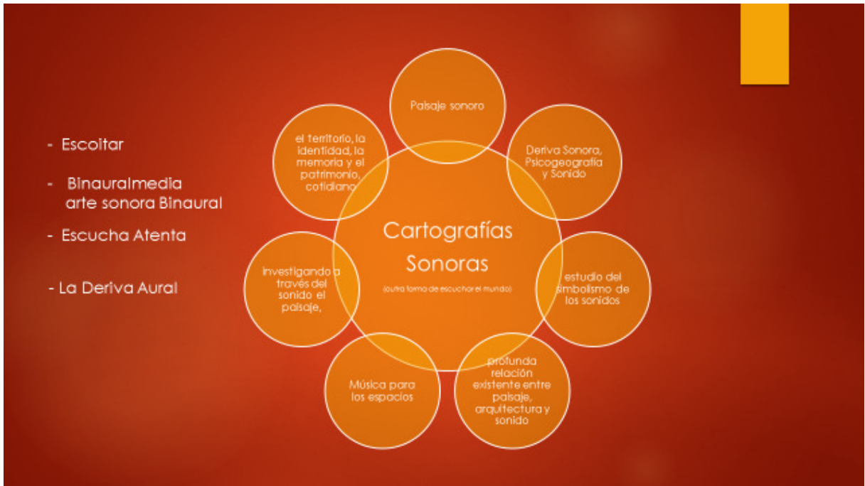
Figura 4 - Cartografías Sonoras