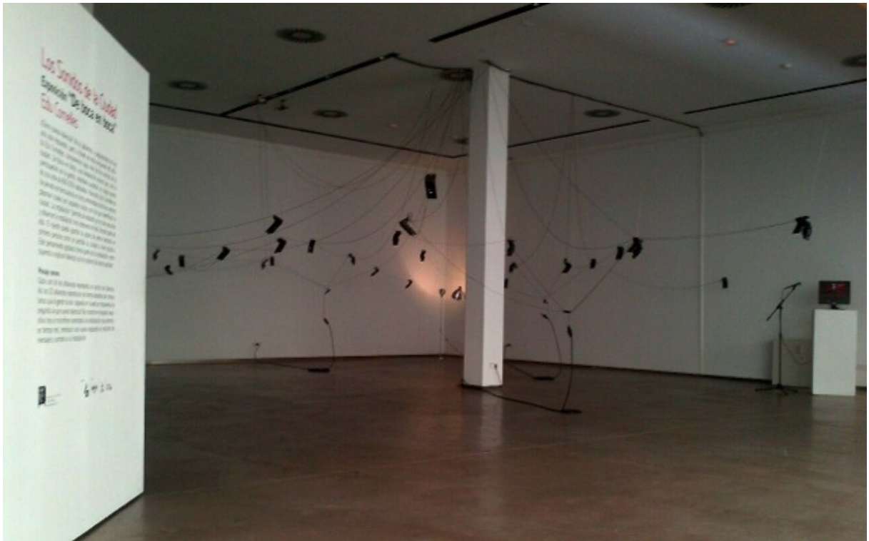
Figura 8 - 'De boca en boca': ¿A qué suena Valencia? Uma exposição de Edu Comelles. Sala de Exposiciones de Espai Rambleta (Valencia), 2015.

Alguns coletivos da Península Ibérica vem demonstrando grande interesse na elaboração de propostas de interface midiática e cultural preocupadas com a questão patrimonial, tanto material quanto imaterial e natural. Outra reunião de artistas que vem se debruçando sobre as cartografias sonoras, sobre as paisagens sonoras, também está em solo Espanhol. Escuta Atenta, 13 dirigida pelo fonografista, artista e compositor Juanjo Palacios e o artista valenciano Edu Comelles, está voltada ao ato da escuta atenta do mundo, preocupados e tomados pelas surpresas que o sentido da audição pode mostrar e abrir na percepção humana do espaço. Estes artistas, nos últimos anos, vêm desenvolvendo vários trabalhos de produção, investigação e educação centrados na cultura aural e na exploração do espaço sonoro.