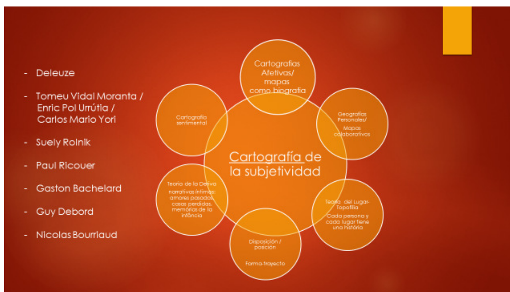
Figura 2 - Cartografia da Subjetividade

Este trabalho visa, deste modo, construir uma ponte entre alguns eixos e métodos de pesquisa instaurados por nós e encontrados em outros autores para poder elaborar um mapa sobre estudos cartográficos: