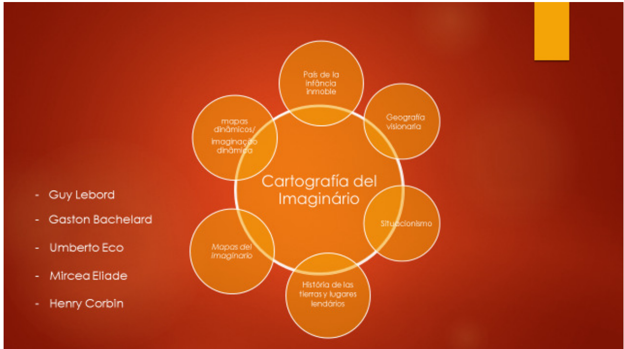
Figura 3 - Cartografia do Imaginário

imaginação, nos anima a pensar que nossos propósitos caminham em direção a uma ânsia coletiva por novos modelos de apreensão de mundo e de responsabilidade coletiva.