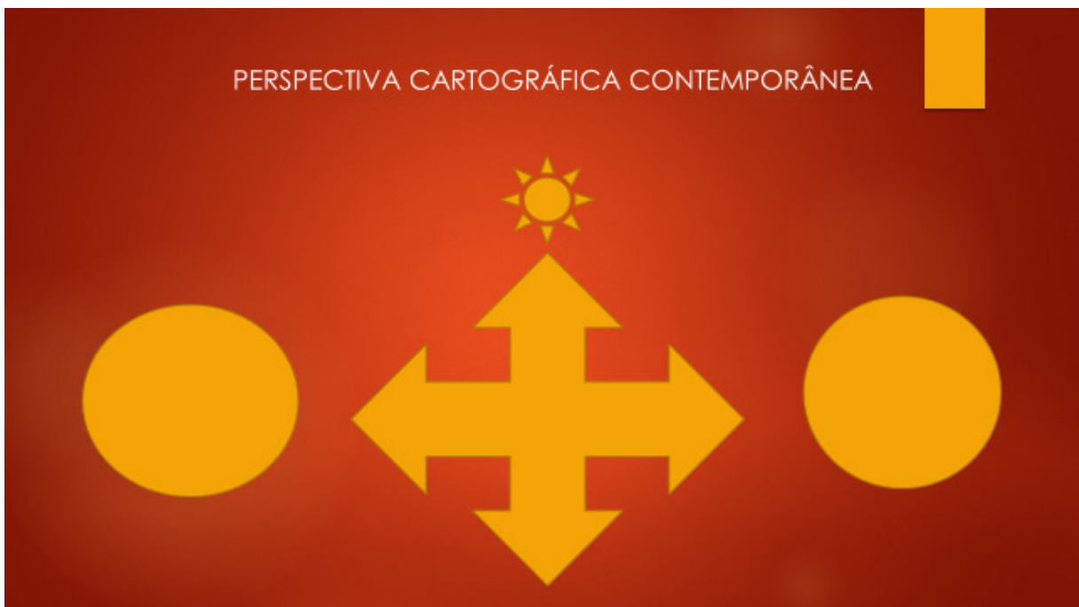
Figura 1 - Perspectiva Cartográfica Contemporânea

Nossos interesses em compor produtos e informações e desenvolver instalações lúdicas, midiáticas, interativas, poéticas e coletivas possibilitou um entrecruzar de pensamentos, criações e propostas. A “criação de mundos”, por meio de instalações, objetiva que o público desvende e abra em si mesmo, na relação com o outro e com o mundo, percepções e entendimentos permeados por canais racionalizantes e sensíveis. Quando começamos a pesquisar as possibilidades de criar instalações cartográficas colaborativas, almejávamos a criação de interfaces que redimensionassem a percepção espaço temporal. A obra de arte e, em particular e mais intensamente ainda, os processos de criação artística contemporâneos, implicam numa releitura do sujeito consigo mesmo, com suas capacidades imaginativas, de geração e acesso à uma subjetividade multidimensional que permita uma recomposição do sujeito com o mundo.