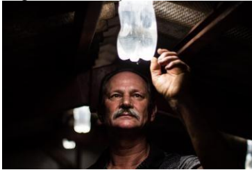
Figura 3: Lâmpada de Moser