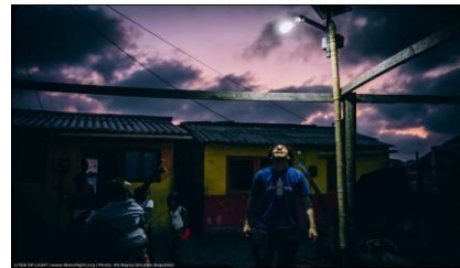
Figura 4: Ilustração do funcionamento do poste