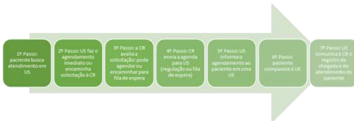
Figura 3 – Fluxo de Atendimento Regulado sem Autorização Prévia