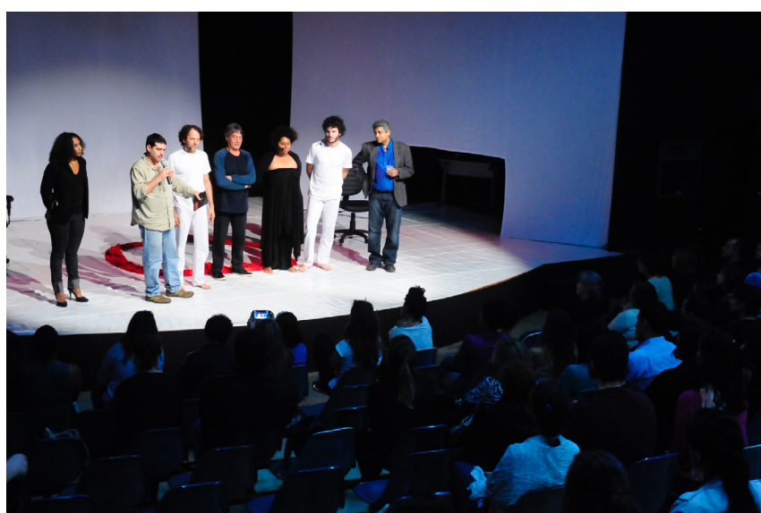
16. Coda: Depois do espetáculo. Agradecimentos

Recebido em: 23/10/2018 | Aprovado em: 30/11/2018