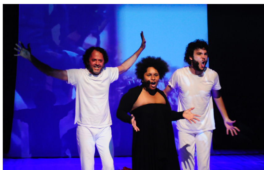
14 e 15. Da cena para as ruas: canção sobre as mortes mútuas entre iguais, “Perto do Fim”, com projeções das manifestações urbanas de 2013.