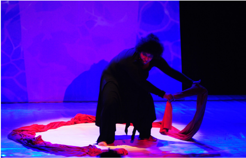
11. A mãe/esfinge narra a história terrível da família de Édipo, na canção “O Mito”.