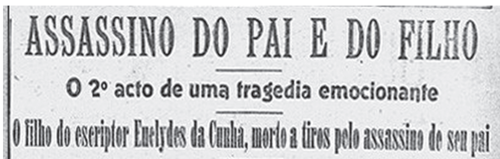
Figura 5: Notícias do jornal O Paiz sobre a tragédia da Piedade

Dilermando de Assis, o assassino de Euclides da Cunha, chega ao Rio ( A Época , 19 de julho de 1914).