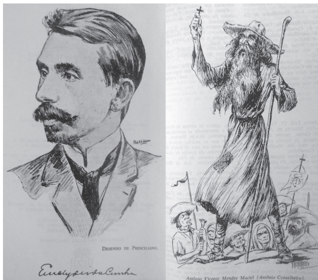
Figuras 6 e 7: Euclides da Cunha e Antônio Conselheiro

Euclides era “o grande homem pelo direito”, o herói nacional da República, isto é, da civilização.