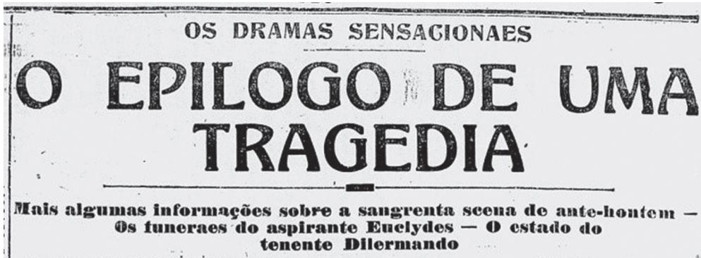
Figura 4: Gazeta de Notícias , 6 de julho de 1916