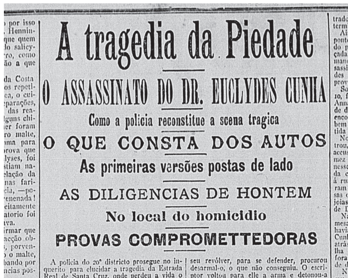
Figura 3: Correio da Manhã (RJ), 20 de agosto de 1909