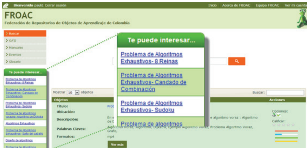
Figura 4. Resultados de la recomendación.