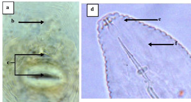
Figura 14. Microfotografía del patrón perineal (a) y parte anterior (d) en Hembras de Meloidogyne incognita . b) Arco dorsal alto; c) Ano y vulva; e) Cono del estilete curvado; f) Nódulos.

distancia DGO midió de 2 µm a 4.5 µm (3.2 µm ± 0.5 µm), lo cual es típico de la especie Meloidogyne incognita (Tabla 1).