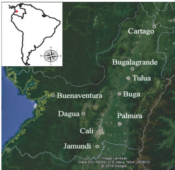
Figura 1. Sampling sites of Achatina fulica in the Valle del Cauca, Colombia. Landsat image center at 3°45'2.89"N – 76°32'52.17"O. Height 350 Km. Data from: SIO, NOAA, U.S. Navy, NGA, GEBCO.

temperature of 24°C, and the last one city, Buenaventura (3°53'N -77° 05'W), the main maritime port of Colombia in the Pacific coast, was located within the biogeographic Chocó region, at 7 m about mean sea level, 7650 mm annual precipitation and annual temperature ranging between 25 and 28°C (5).