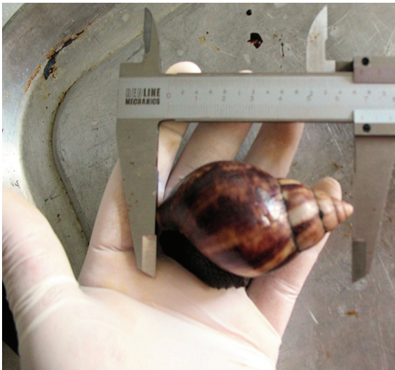
Figure 2. Giant African snail ( Achatina fulica ) individual collected for parasitological analysis in the Valle del Cauca, Colombia.

Buenaventura (42.9% 2013 and 30.0% during 2014) and Cali (33.3% during 2013 and 30.0% during 2014). (Table 1).