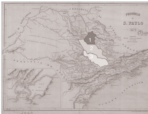
Figura 5: Em destaque a Freguesia de Franca (1), Freguesia de Batatais (2) e a Freguesia de Casa Branca (3). Interpretação feita sobre o Mapa da Província de São Paulo, 1879, de Claudio Lomellino de Carvalho