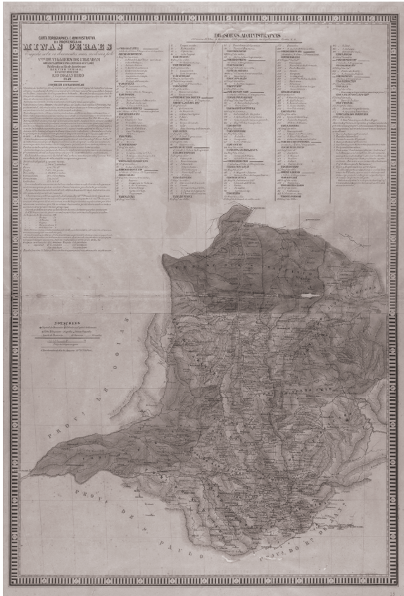
Figura 3: Interpretação nossa na Carta topographica e administrativa da província de Minas Geraes, 1849, de Visconde de Villiers de L'Isle Adam. Destacamos nesta Carta as Comarcas de origem dos entrantes mineiros no nordeste de São Paulo.