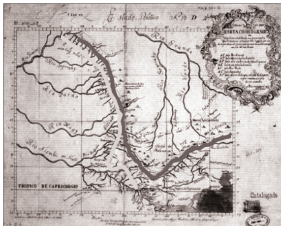
Figura 2: Interpretação da divisa entre Minas e São Paulo na Carta Chorografica da Capitania de São Paulo..., elaborada pelo Morgado de Mateus. A linha cinza escura grossa e os códigos (A1, A2, A3, A4, A5, A6 e A7) definem as divisas entre Minas Gerais e São Paulo. A linha cinza clara grossa define o caminho de Goiás.