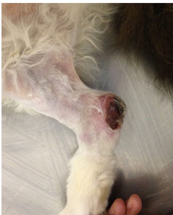
Figure 1. Medial aspect of right hind limb of a 13-years-old, male, Domestic Longhair cat with FCTL. A subcutaneous and ulcerated mass is located in the tarsus.

were observed in the analyses. However, abdominal ultrasound revealed increased medial iliac lymph nodes, loss of typical morphology and rounded shape. Furthermore, mixed echogenicity, increase in vascularization and irregular blood flow distribution in the parenchyma were detected on Doppler ultrasound scan.