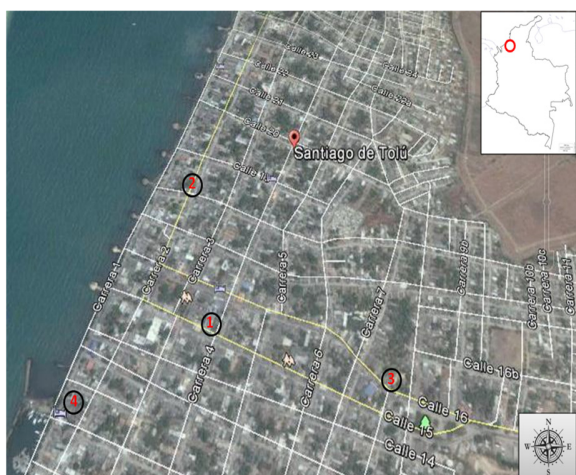
Figure 1. Study area and sampling sites (Google earth version 5.0 free).

Sampling: The total sampling method (16-19) was applied, worked during six months of 2015, three months in dry season: January to March, and three months in rainy season: September to November; A weekly count was performed for each point simultaneously, which is equivalent to a total of 24 samples in total for each point; With daily sessions from 06:00 to 08:00 hours, with counts timed every hour (13,14).