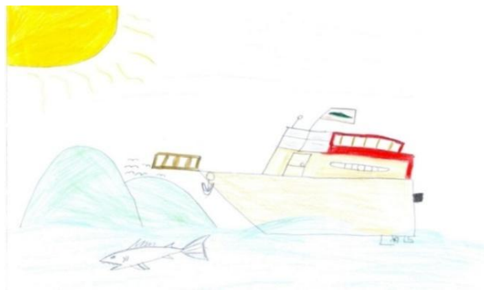
Figura II: O Que é Turismo para Zeus.

O desenho do Zeus representa um “barco de Paranaguá a Encantadas levando turistas no feriado. O morro é à frente da Encantada e o peixe é porque tem bastante aqui!”.