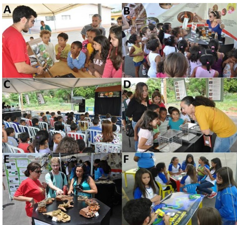
Figura 2: Ações educativas durante a exposição. (A) Experimento “Como as serpentes enxergam no escuro?” Zooteca – NOAP/UFBA. (B) Ciência e Movimento - FUNED. (C) Teatro de Fantoches - NOAP/UFBA. (D) Animais vivos (IVB). (E) Réplicas - IB. (F) Jogo “Serpenteando a Amazônia” Zooteca - NOAP/UFBA.

Uma das preocupações centrais dos divulgadores de ciência é promover uma exposição que, de fato, possibilite uma real e significativa compreensão por seus visitantes. Segundo Marandino (2008), nas últimas décadas houve uma mudança de paradigma frente as abordagens comunicativas em museus, agora assumindo o público como protagonista no processo comunicativo. A mesma autora relata que a responsabilidade em produzir exposições e atividades que contemplem o ator principal, ou seja, os visitantes, pertence aos museus. Sendo assim, é essencial que o visitante seja protagonista da sua própria aprendizagem dentro destes espaços para que a mediação possa se realizar de maneira efetiva. É preciso que os museus sejam bastante objetivos e claros no planejamento e execução das atividades propostas. Para isso, é preciso que, entre outros aspectos, os museus adotem em sua concepção museográfica distintas abordagens sobre uma mesma temática, permitindo assim uma melhor integração por parte do visitante. Dessa forma, percebeu-se que a exposição “Animais Peçonhentos em Rede” cumpriu o seu papel multi-museus, justamente por contar com uma ampla variedade de ferramentas educativas, atendendo assim à pluralidade do seu público visitante.