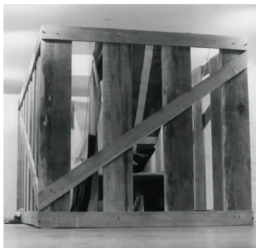
Carlos Vergara. Berço esplêndido, 1978.