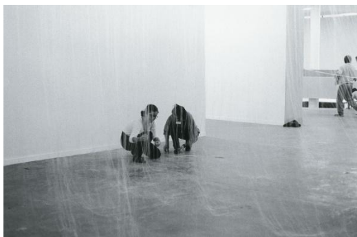
Mira Schendel, Ondas paradas de probabilidade , 1969. 22ª Bienal (1994). Montagem.

A arte sempre será política, em seu engajamento ou sua abstenção. Assim como Barnett Newman via suas sublimes abstrações como revolucionárias, o mais sutil gesto artístico contém em si uma posição frente ao mundo, frente à cultura, frente à arte. O humano impera, pois comove. Somos eminentemente públicos. Somos políticos.