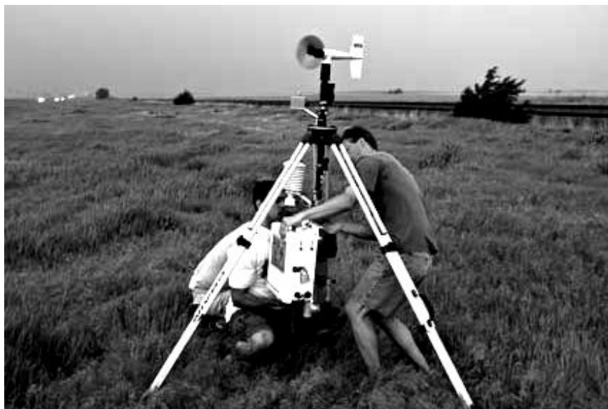
Figura 1. Montagem de uma micro-estação móvel. Adaptado de Weiss; Schroeder, 2008. (continua...)

Uma das metas do projeto é dar o primeiro passo no teste do conceito de uma micro-rede de observação adaptativa que pode ser deslocada sob a demanda de um experimento de campo ou de um sistema de previsão de tempo, aumentando-se a cobertura observacional numa região-alvo relativamente pequena visando monitorar fenômenos convectivos em superfície na escala meso-gama.