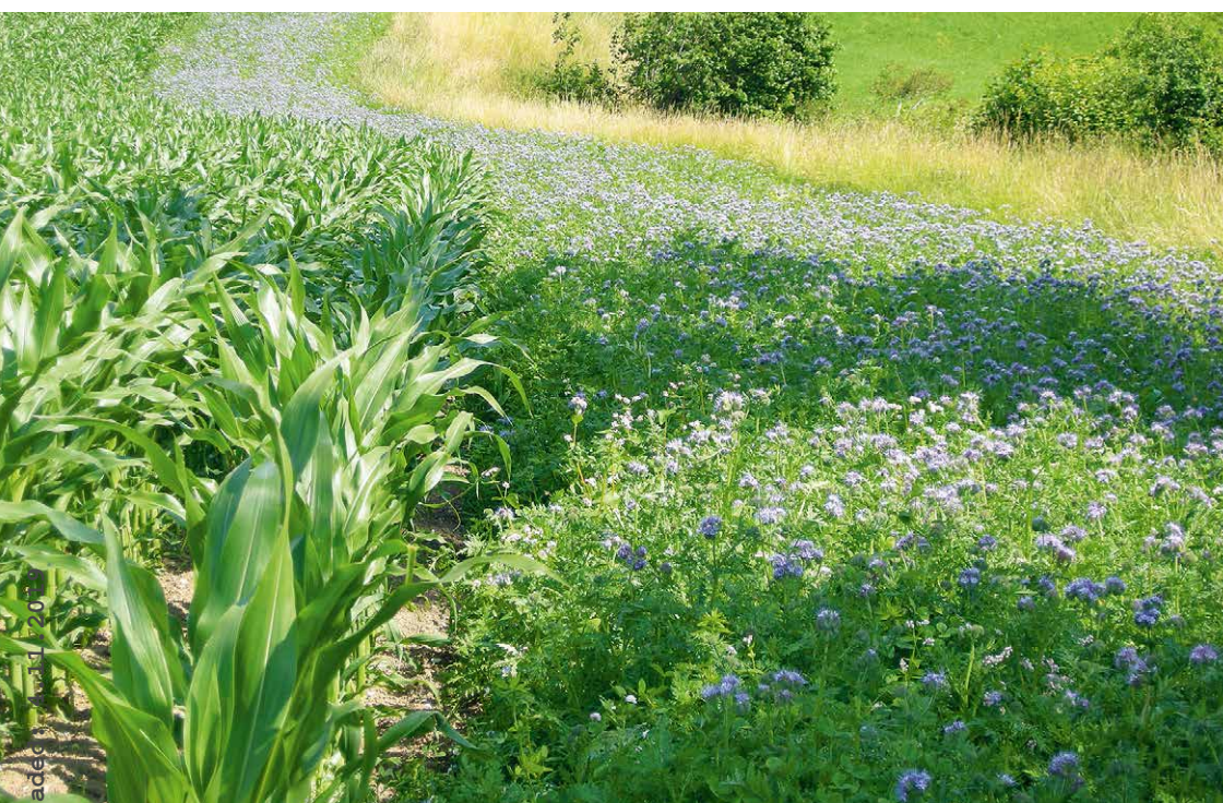
Abb. 1 | Blühende Pflanzen während der trachtarmen Zeit im Sommer sollen Bestäubern und anderen Nützlingen Nahrung bieten: Blühstreifen in der Vollblüte von Phacelia.

Auskünfte: Hans Ramseier, E-Mail: hans.ramseier@bfh.ch